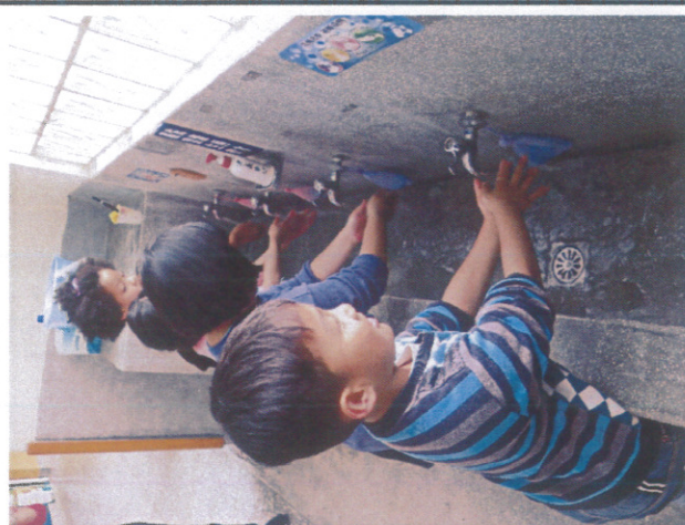
小朋友培養勤洗手觀念