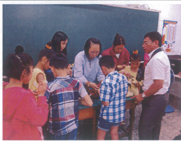
親子一同製作健康水果塔