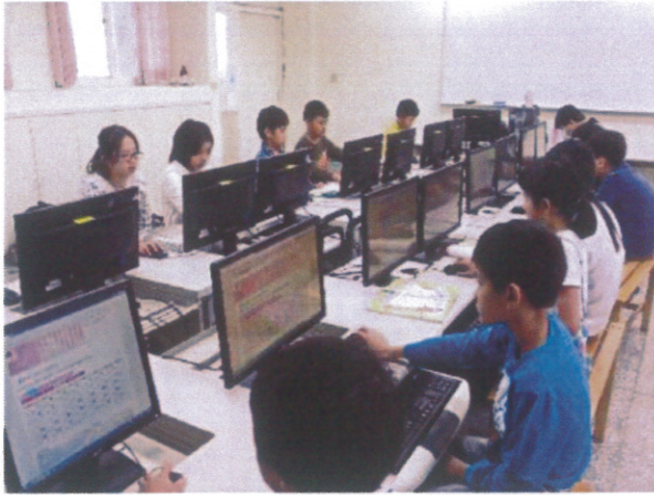
鼓勵學童上網填寫教育部健康護照，隨時檢視自己運動狀況。