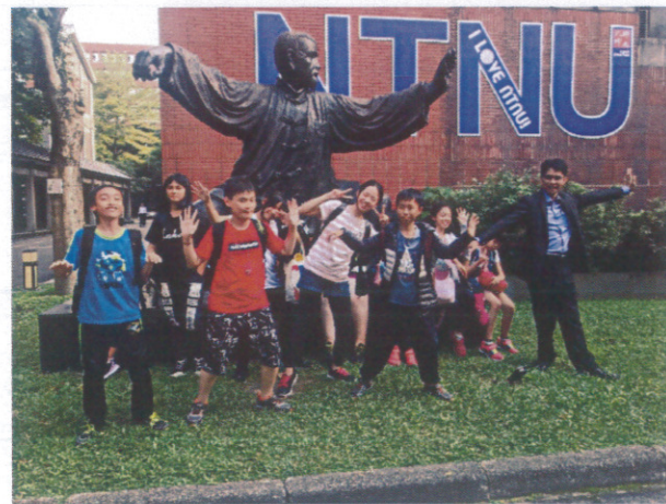
健康促進-體驗背包客之畢業旅行