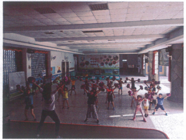
辦理各式體育社團-有氧體操