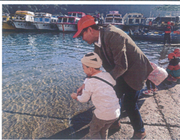
中低年級參加魚苗放養戶外活動