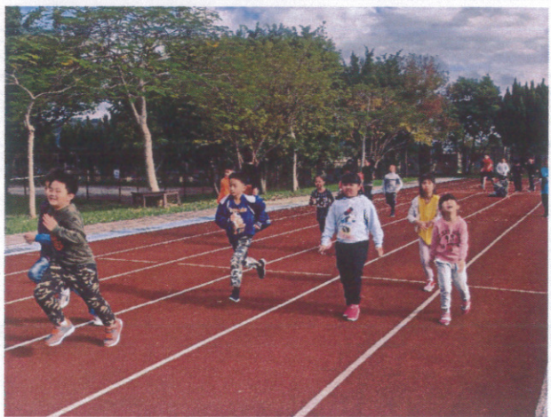
每週固定進行全校性跑走活動