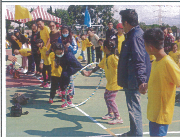
107.10.27 健康促進暨社區運動會 親子一同為健康努力