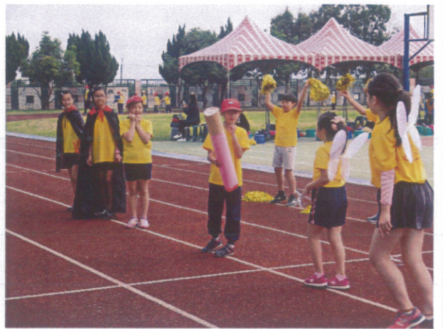
107.10.27 健康促進暨社區運動會 (反菸拒檳宣導)