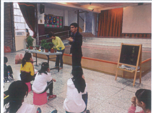
反毒宣導-認識香草