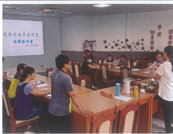
教師營養教育研習-製作水果塔