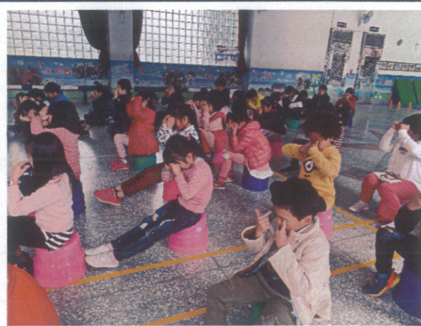
每週固定練習愛眼操