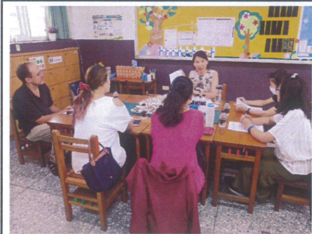
老師於親師座談會宣導學生健康需知