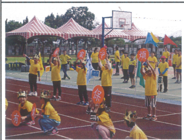
107.10.27 健康促進暨社區運動會 (全民健保宣導)