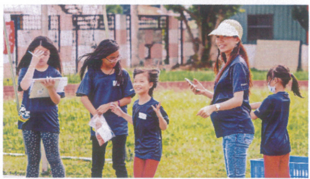
與黃烈火基金會合作舉辦小鐵人三項活動