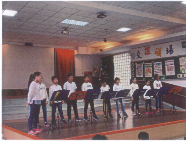
心靈健康促進-反霸凌廣播劇演出