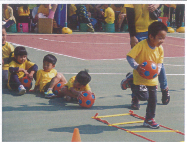
辦理各式體育社團-兒童足球社