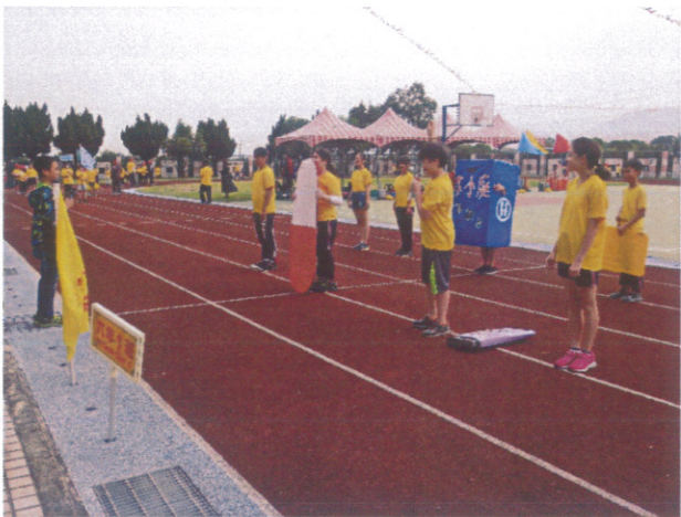
107.10.27 健康促進暨社區運動會 (正確用藥宣導)