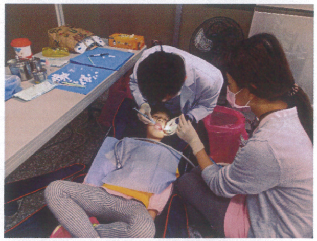
牙醫診所到校為學童做窩溝封填