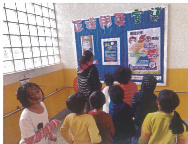
利用佈告欄公開宣導-正確用藥