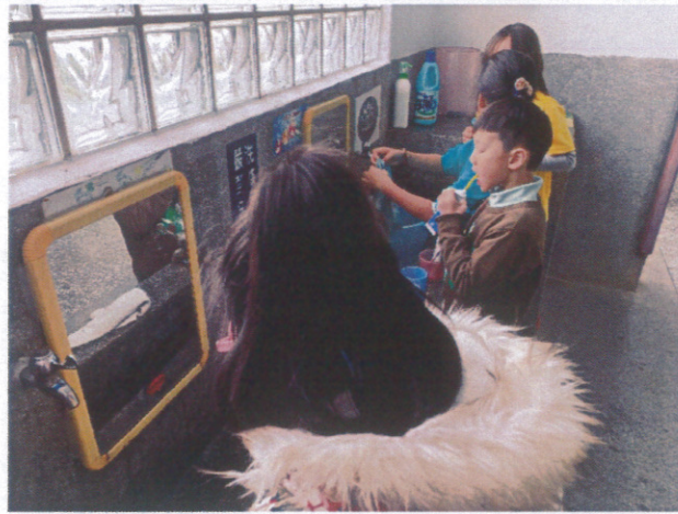
學生每日中午餐後潔牙