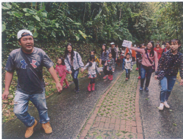
全校師生進行戶外教育