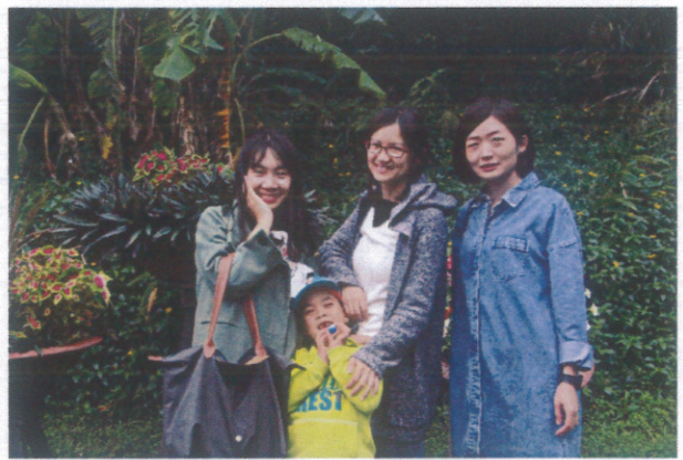
健康促進-員工戶外教育