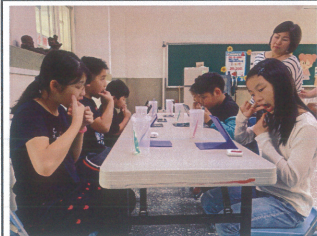
參加潔牙比賽學生練習