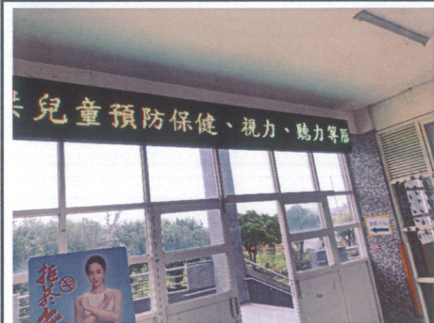
利用跑馬燈將健康資訊傳播至家長及社區人士