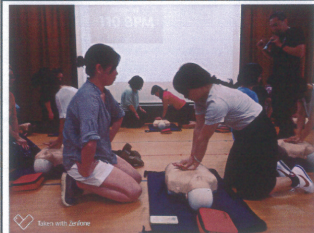
教師參加心肺復甦術訓練