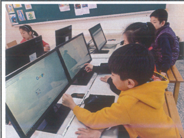
學生利用資訊課上網獲取藥物濫用新知