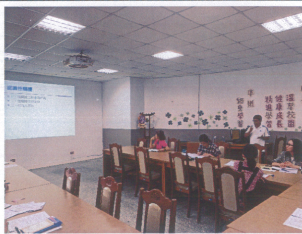
心靈健促-性別平等教師研習