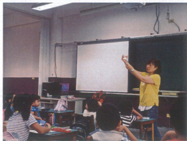
護理師入班講解健康檢查注意事項