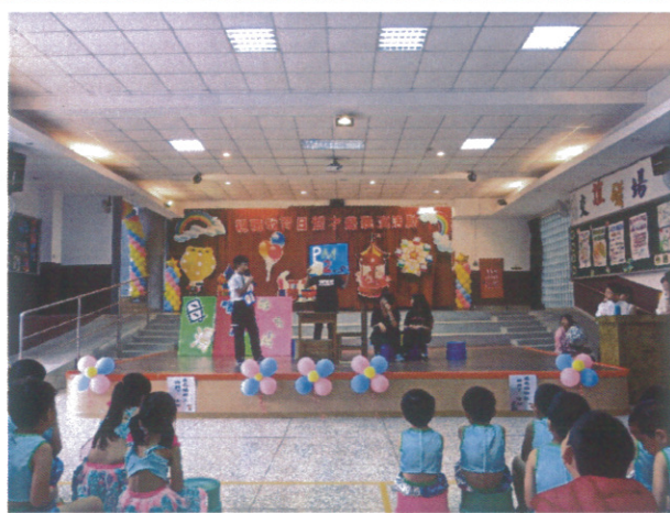
學生於親職教育日公開宣導-認識PM2.5