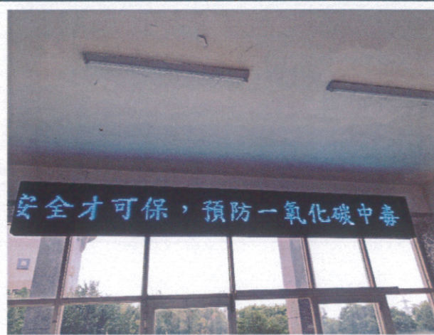
利用跑馬燈將健康資訊傳播至家長及社區人士