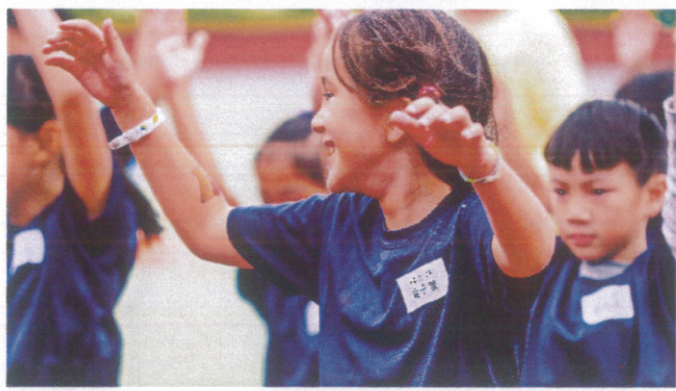
與黃烈火基金會合作舉辦小鐵人三項活動