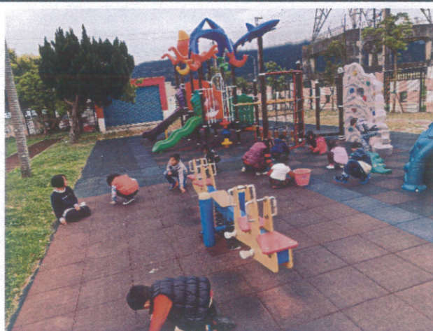
培養健康環境愛校服務觀念-低年級整理外掃區