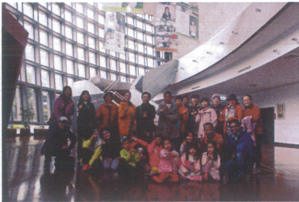
健康促進-志工參訪活動