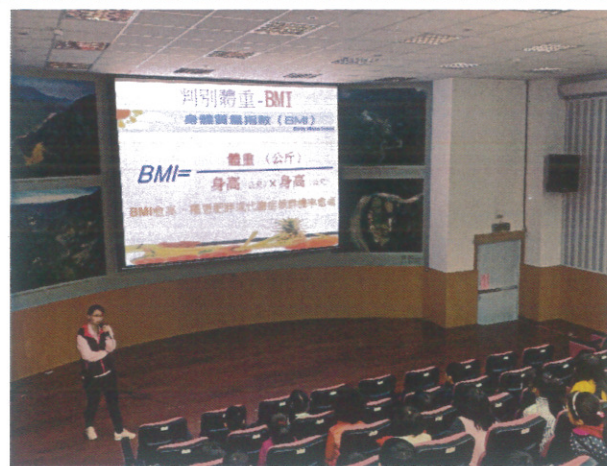
健康體位全校性宣講