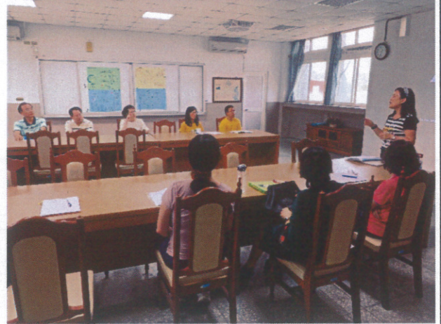
聘請健康促進委員到校進行健康體位研習