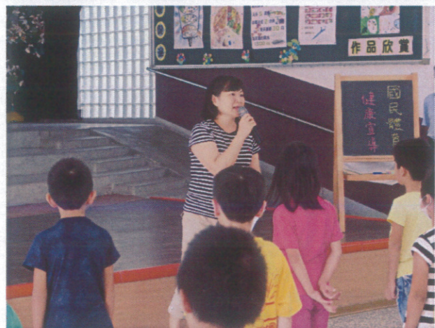
國民體育日-腸病毒注意事項宣導