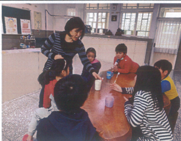
參加潔牙比賽學生練習