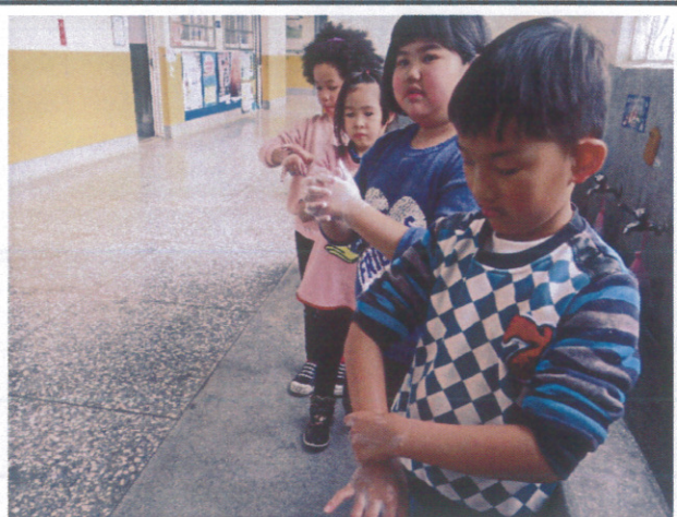
小朋友培養勤洗手觀念-正確洗手