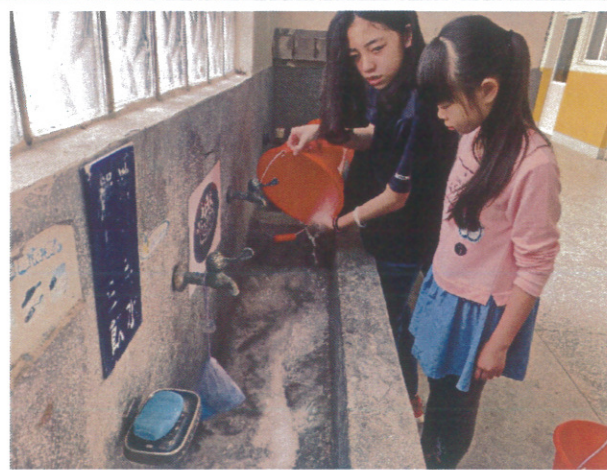
小市長團隊協助登革熱防治