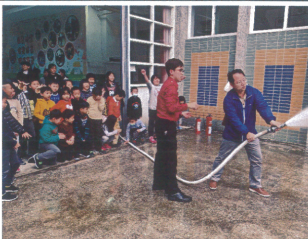
與黃烈火基金會、消防局高平分隊三方合作舉辦師生消防宣導-技術演練