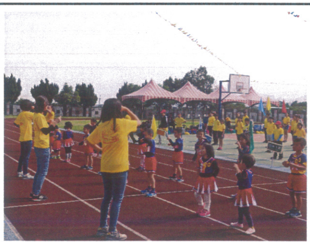
107.10.27 健康促進暨社區運動會 (視力保健宣導)