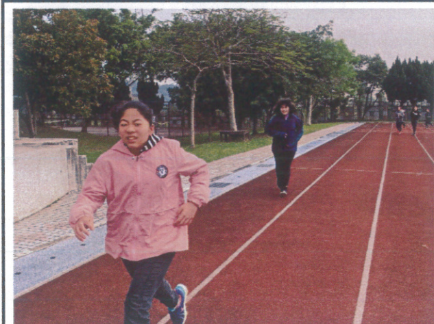
體能精進班日常訓練