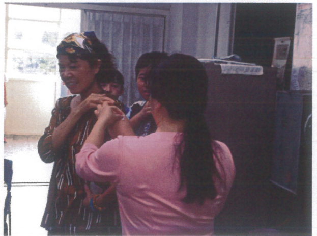
施打流感疫苗-老師一同增加抵抗力