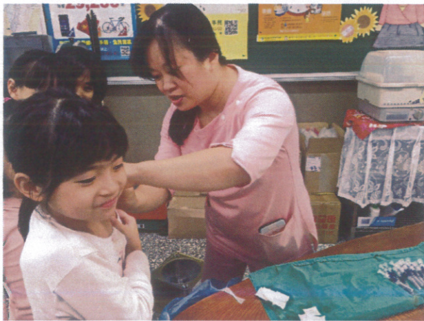
與醫院合作施打流感疫苗