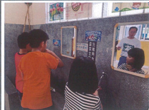
老師指導學生餐後潔牙