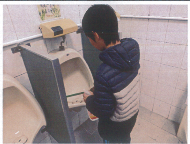
培養健康環境愛校服務觀念-高年級打掃廁所