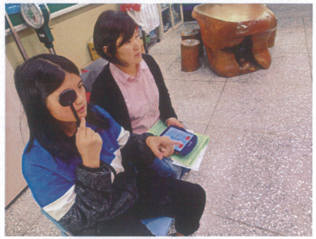
學生半年定期健康檢查