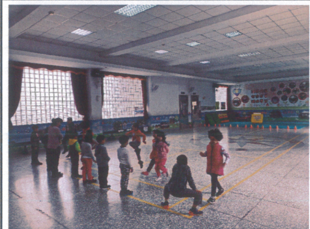
辦理各式體育社團-客家舞蹈社