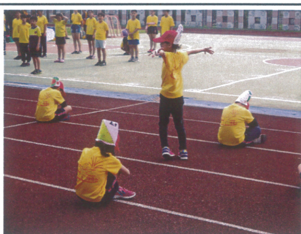
107.10.27 健康促進暨社區運動會 (口腔保健宣導)