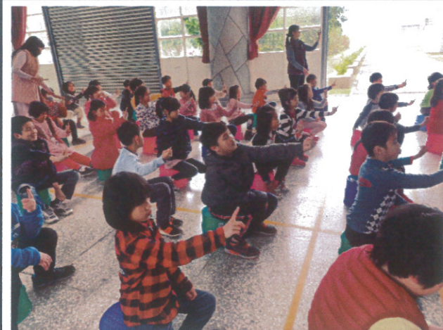
每週固定施作護眼操