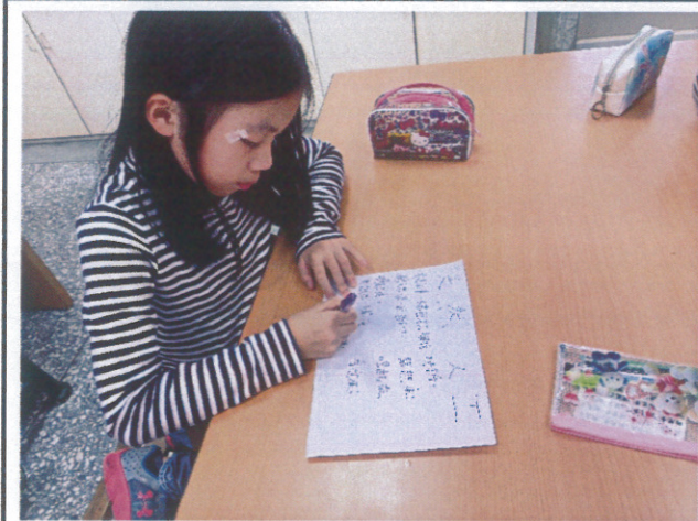
營養教育-食品添加物