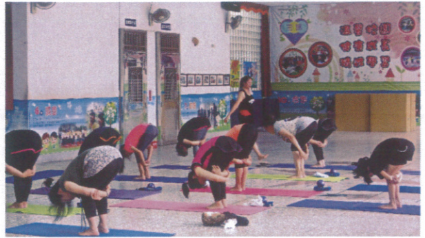
開設社區有氧瑜珈班，傳遞健康知識。