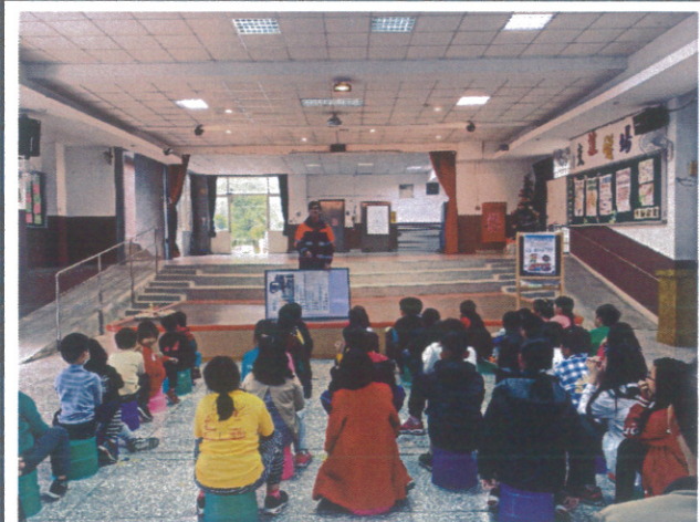
與黃烈火基金會、消防局高平分隊三方合作舉辦師生消防宣導