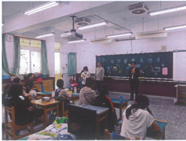
校長於親職教育日宣導健康飲食的重要