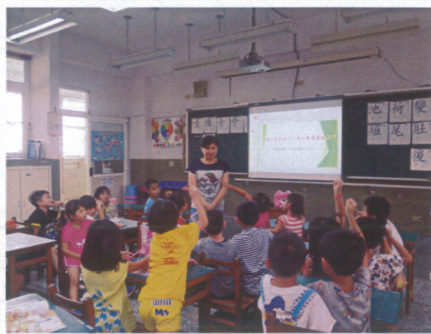
護理師入班(低年級)宣導勤洗手