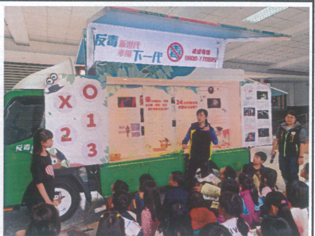
反毒巡迴車到校宣導