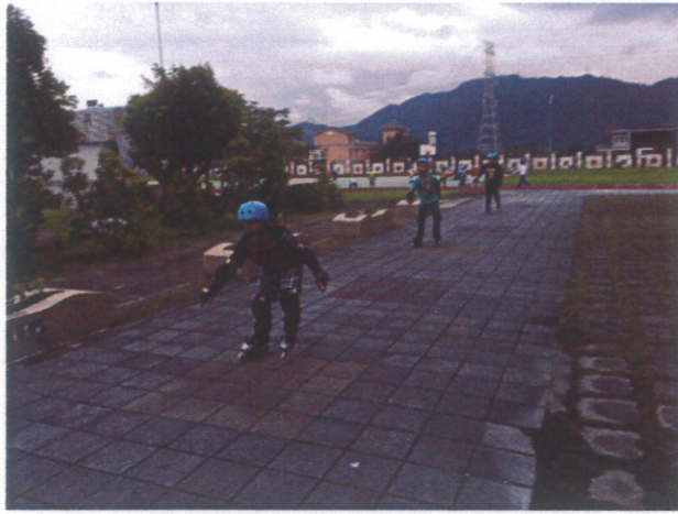
辦理各式體育社團-直排輪社