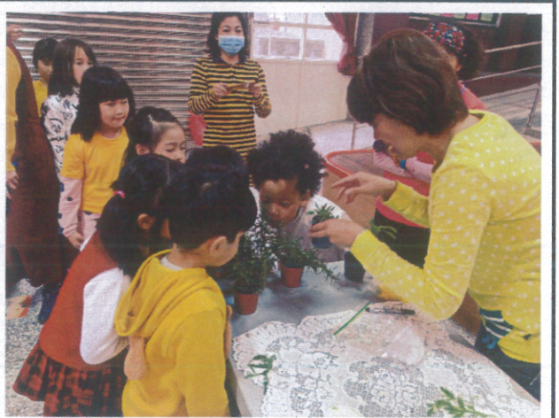
反毒宣導-認識香草