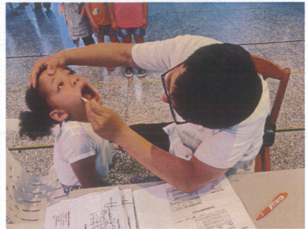
牙醫師到校齶齒檢查