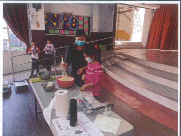
營養教育-天然食品