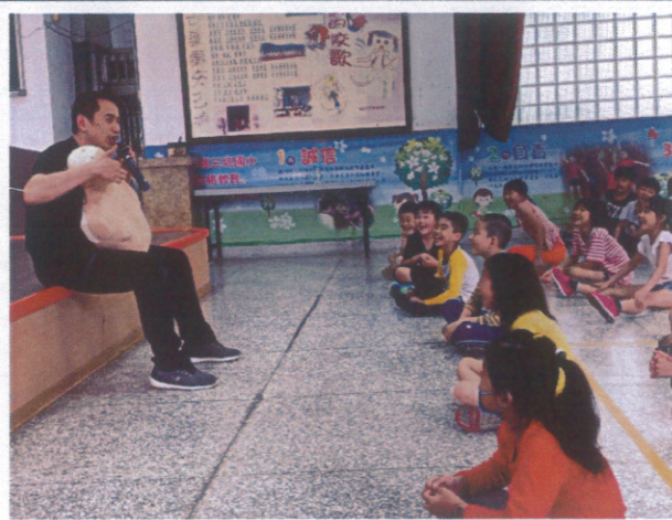
3-6 年級心肺復甦術訓練