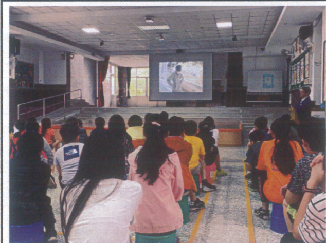
心靈健促-性別平等宣導