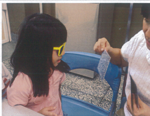
定時健康檢查，關心每個學童成長