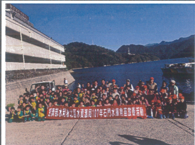
中低年級參加魚苗放養戶外活動