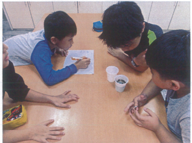
營養教育-食品添加物