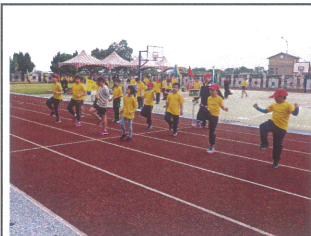
107.10.27 健康促進暨社區運動會 (健康體位)