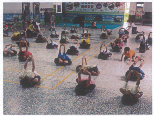
全校學生進行體位訓練