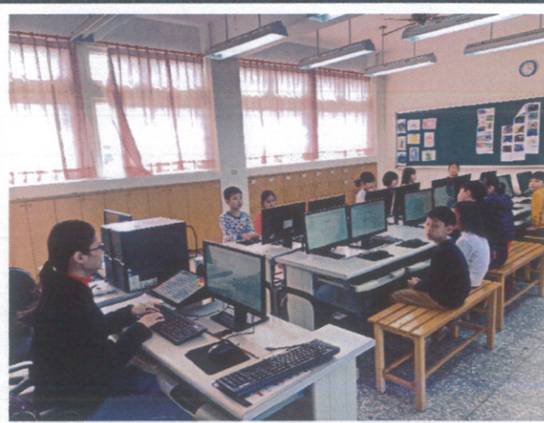
學生利用資訊課上網獲取藥物濫用新知