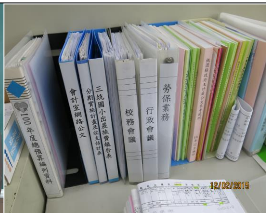
會計業務帳冊分門別類建檔備查