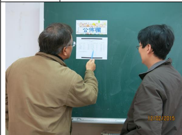
每月將預算分配數及經費執行情形，公佈全校週知