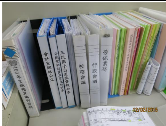
會計業務帳冊分門別類建檔備查