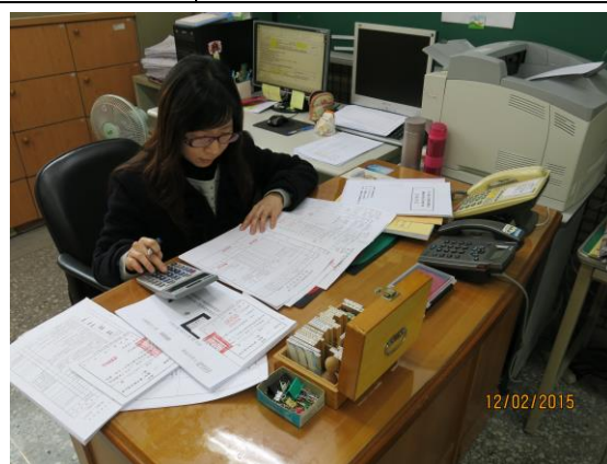
每月依支出憑證處理要點，審計法規暨相關法令規定，確實審核。