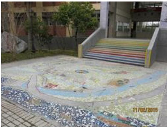
設立校本課程導覽地圖涵養學生熱愛鄉土胸襟