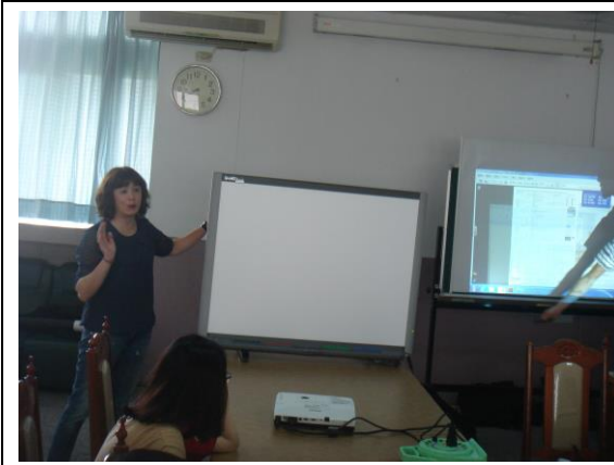
班班設立電子白板，教學活潑化