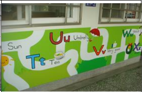
低年級教室走廊英語彩繪牆施