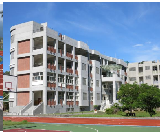
整修稻香樓成美輪美奐的教學大樓，為國家培育優質人才