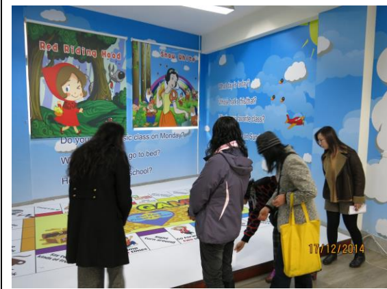
建置英語情境教室，培養學生國際視野