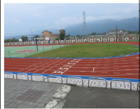
建構安全平坦運動場，培養學生愛好運動健身