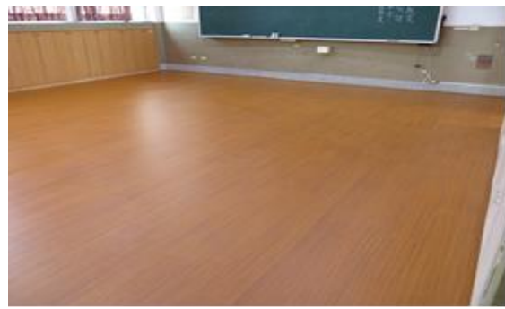
設立韻律教室，培養學生健康身心