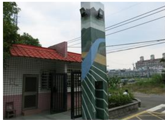
彩繪校門口，強化境教潛在課程功能