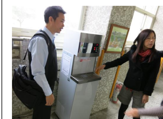
飲水機全校更新，讓師生喝好水