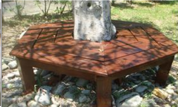
設立校園戶外休憩木椅，提供休閒活動