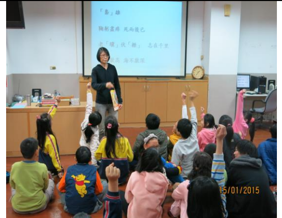
班班裝置投影機，增進學習效益