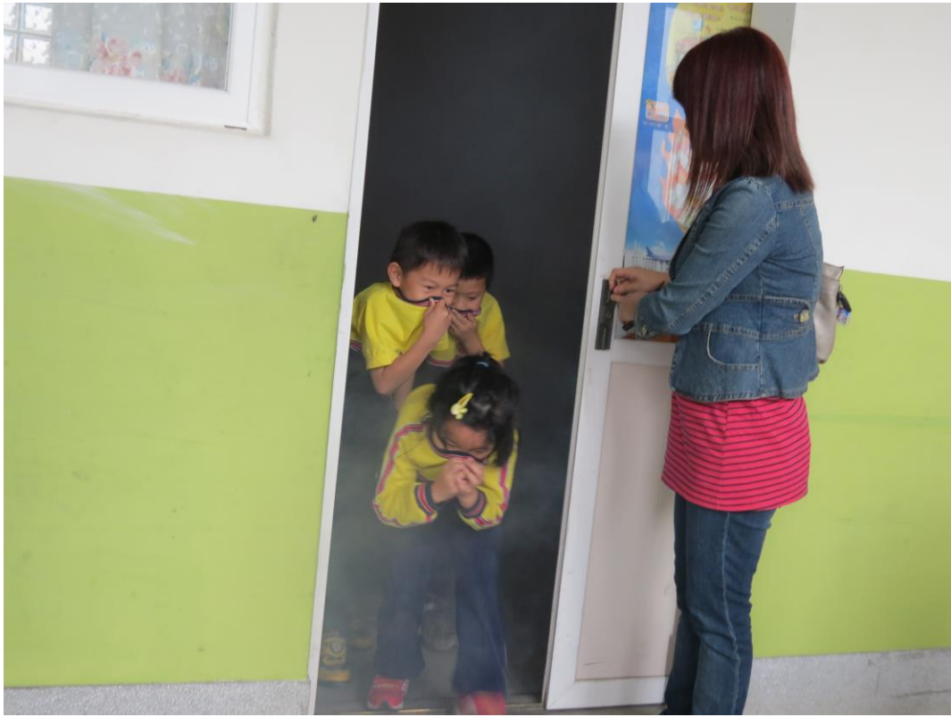
說明：實務操作-煙霧體驗室