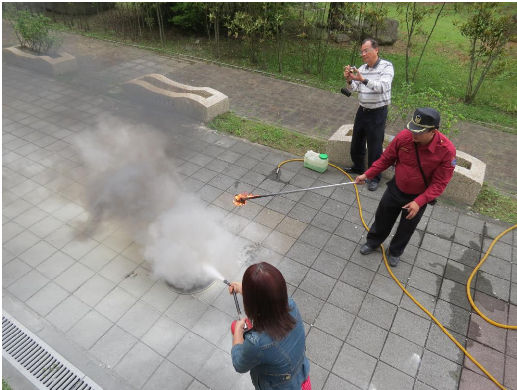
說明：實驗操作-乾粉滅火器應用