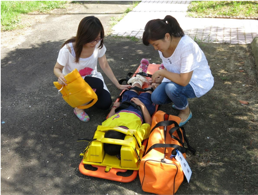
說明：實務操作-救護傷患演練