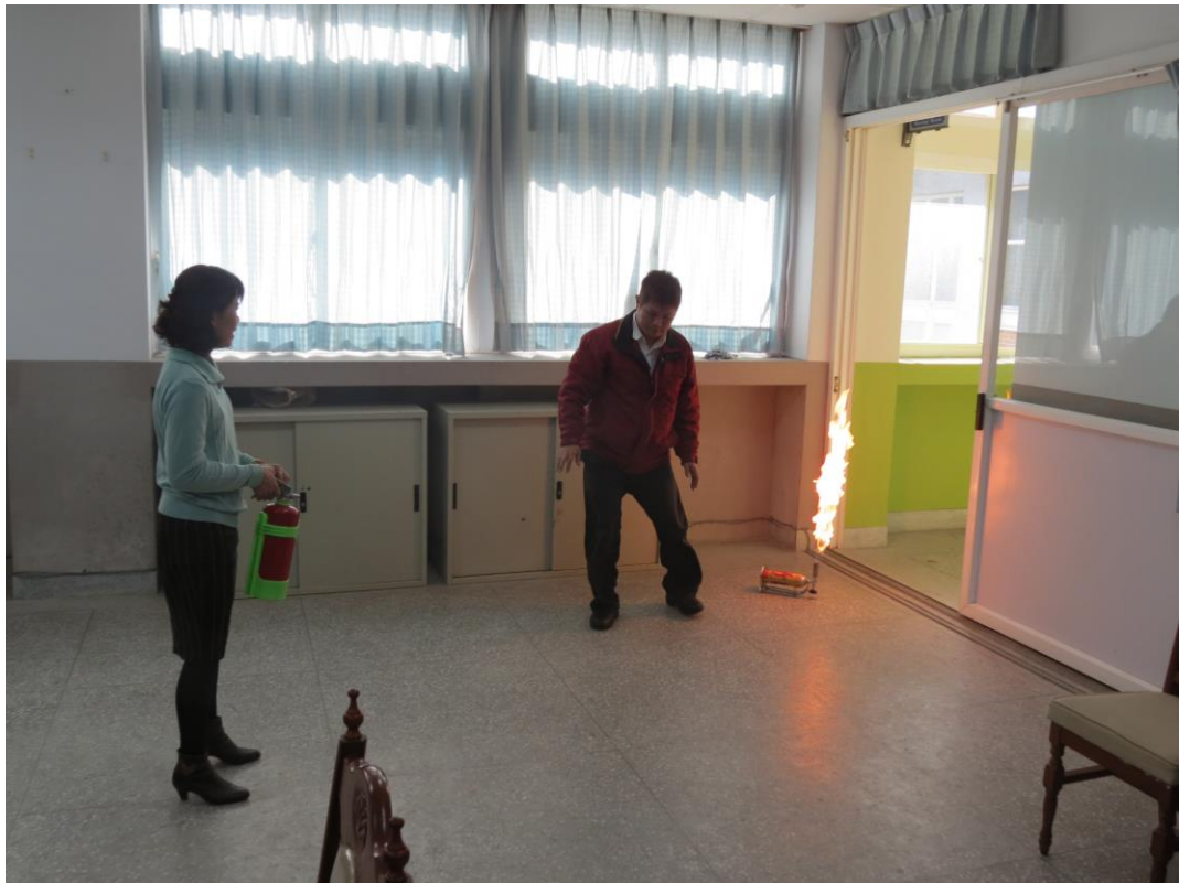
說明：實務操作-海龍滅火器應用