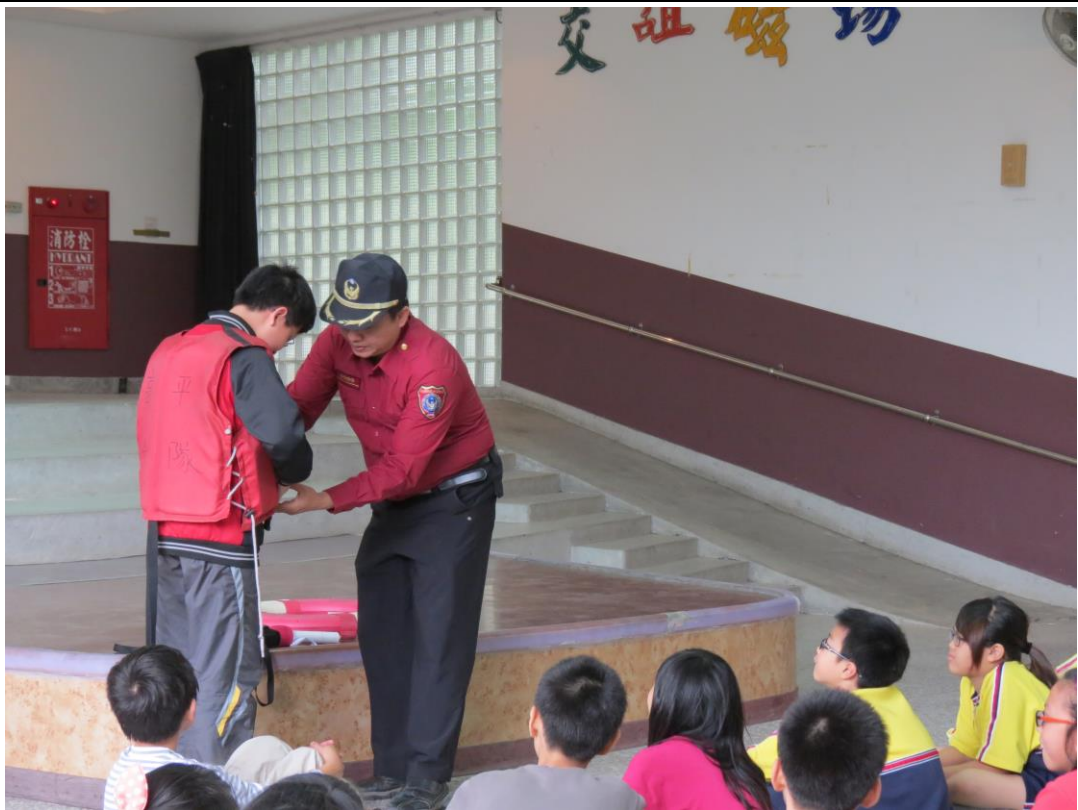
說明：實驗操作-救生衣使用方式