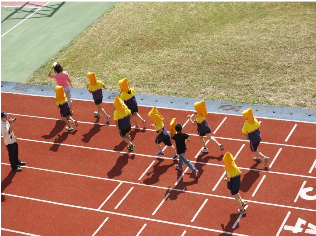
說明：實驗操作-全校疏散至操場