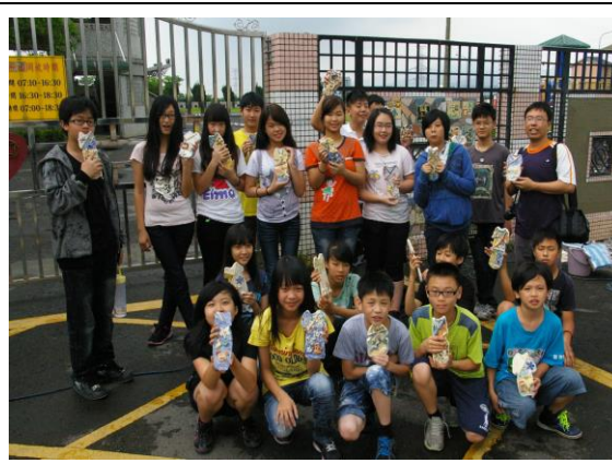
學生作品鑲嵌陶版牆美化校園