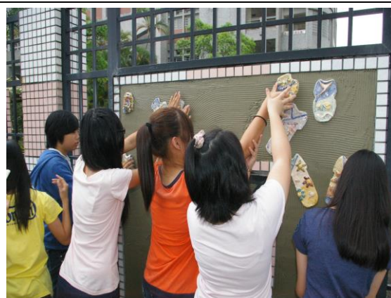
融入課程實施美化校園