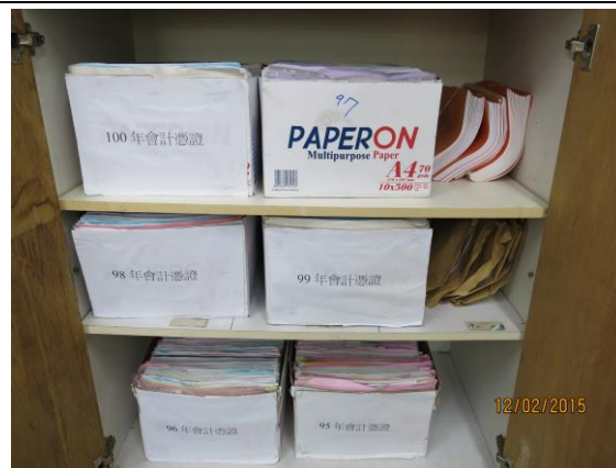
會計業務帳冊分門別類建檔備查