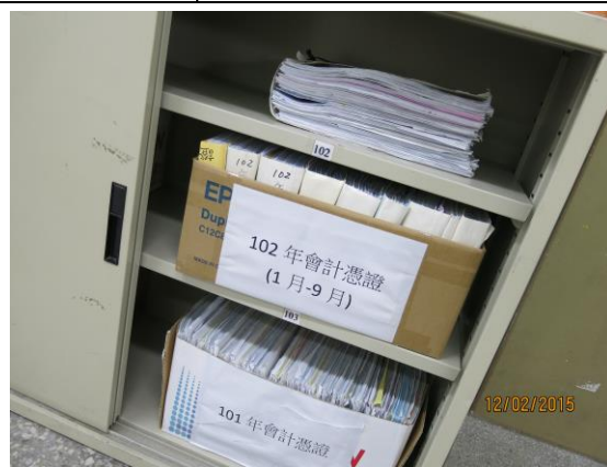
會計報表裝訂成冊，分類存放。