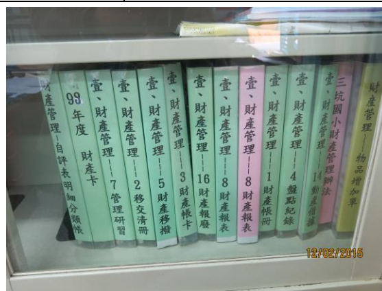
財產業務報表裝訂成冊，分類存放。