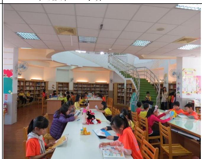
說明：牆上有學校必讀書目 100 本，學生努力閱讀。