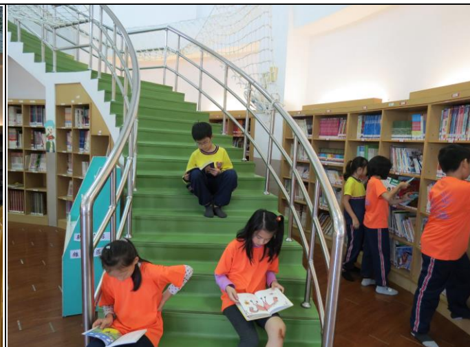
說明：圖書館佈置溫馨多樣，學生也可以在階梯上閱讀。