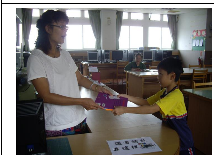
說明：每天皆安排圖書館志工協助借還書及佈置圖書室。