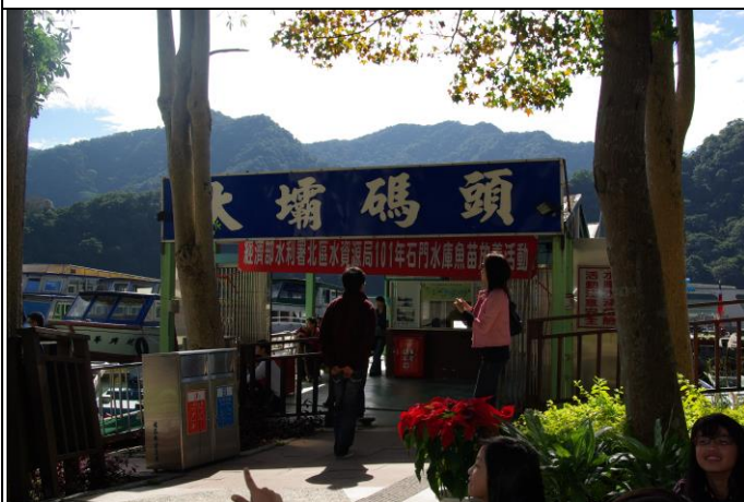
說明：全校於大壩碼頭旁集合