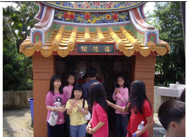
說明：紅橋旁土地公廟