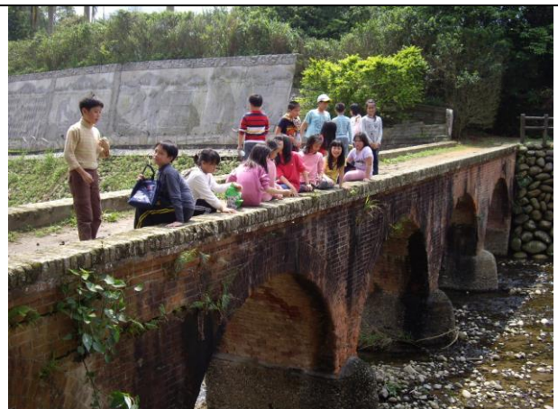
說明：大平紅橋，以紅磚打造，所以被稱為「紅橋」，長十餘公尺，跨越打鐵坑溪，總共有五個橋拱。