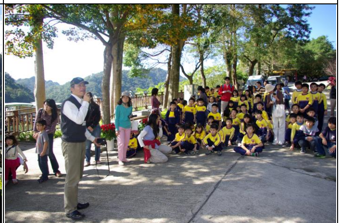
說明：聽取魚苗放養目的與方式說明