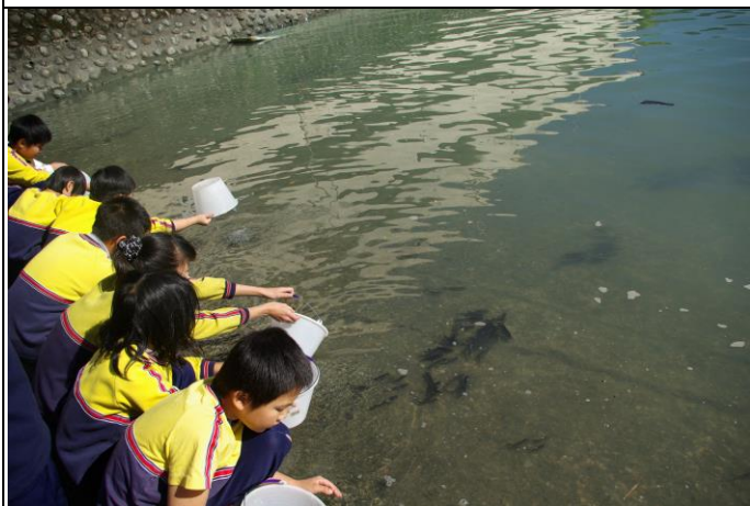
說明：開始魚苗放養