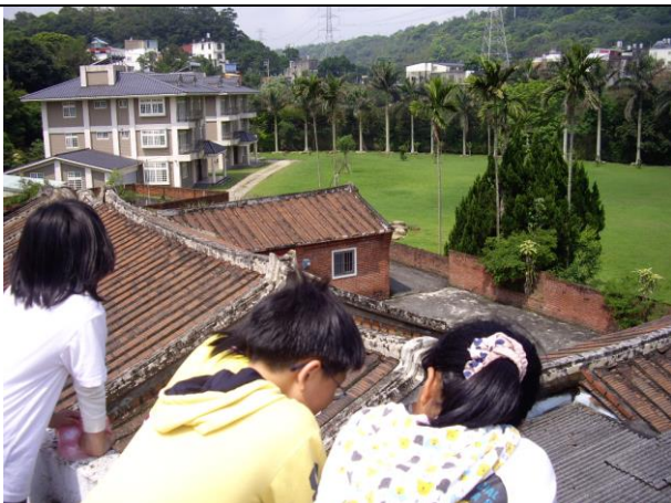
說明：遠處眺望紅橋