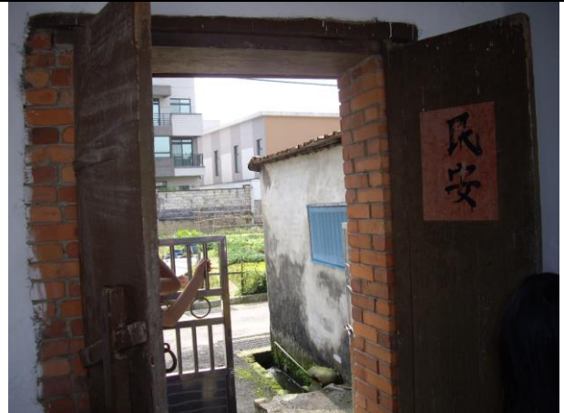
說明：大平村歷史悠久的門