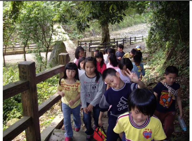
說明：沿著橋旁小路回學校