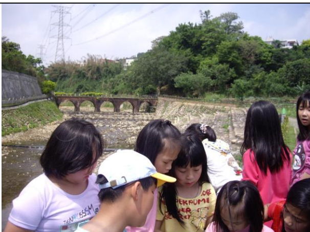
說明：背後就是用糯米及其他建築材料做的紅橋