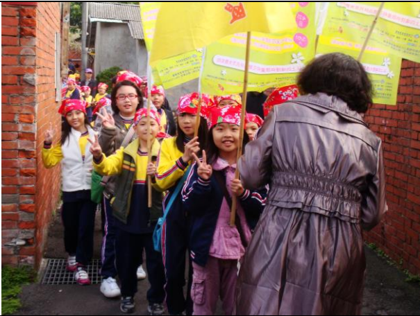
說明：到大坪村參加活動