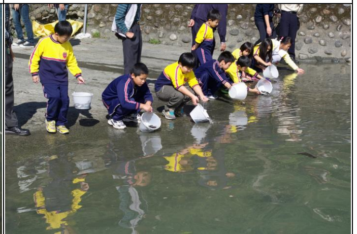
說明：開始魚苗放養