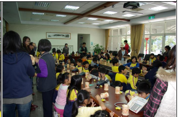
說明：製作木雕紀念品