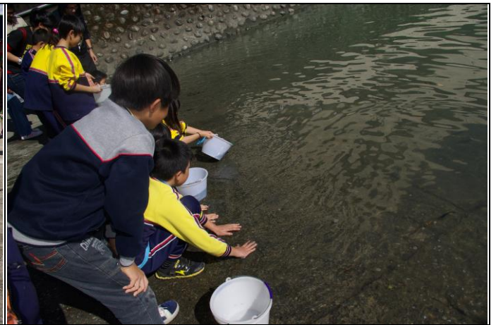
說明：開始魚苗放養