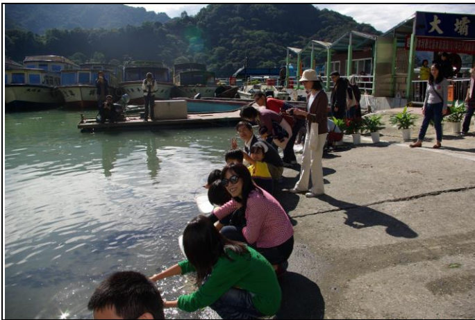
說明：開始魚苗放養