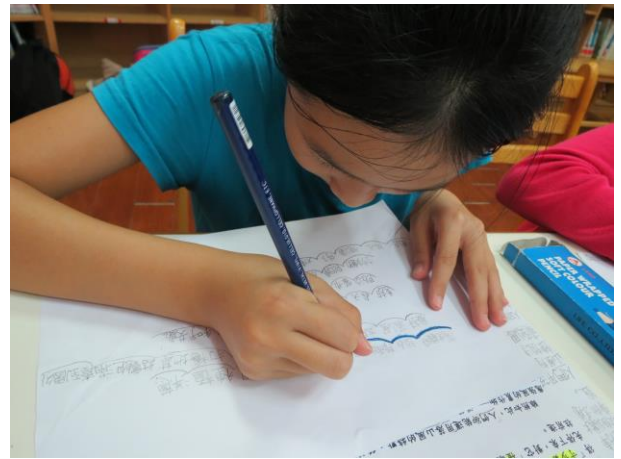
說明：分析教材—畫出心智圖