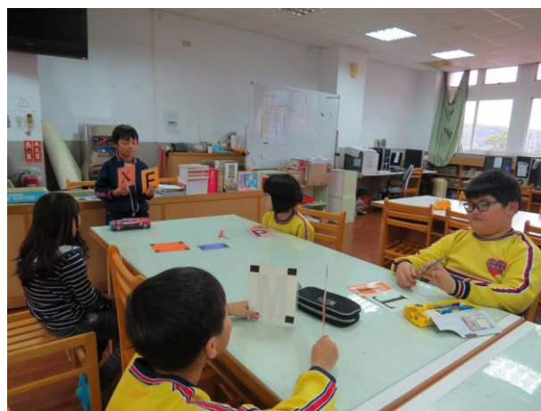
說明：上台擔任小老師