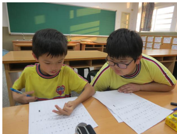
說明：測試學生識字量