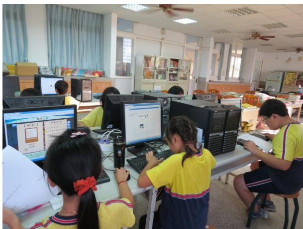
說明：上線至明日星球