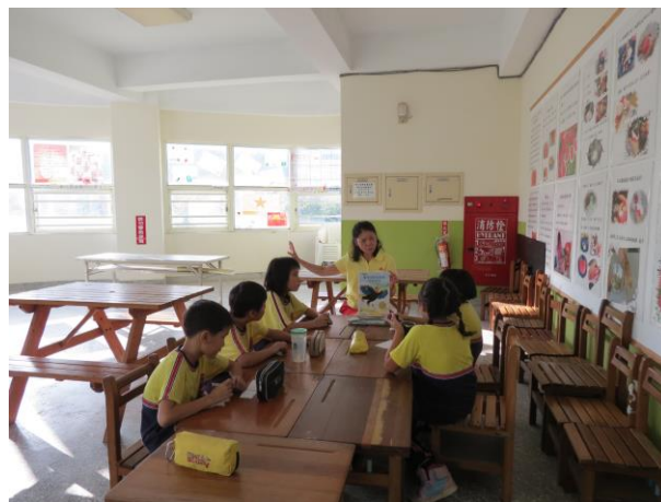
說明：老師解說今日上課主題