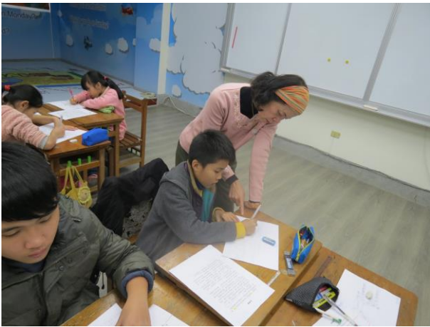
說明：分析教材—畫出心智圖