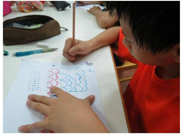
說明：分析教材—畫出心智圖