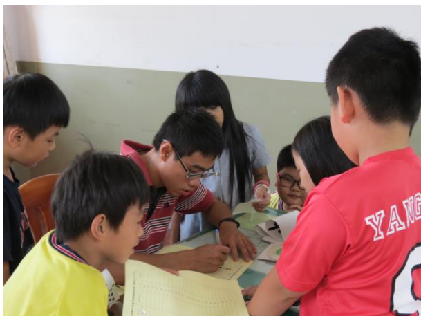
說明：學生回答老師提問