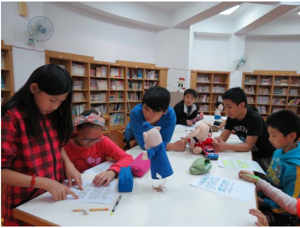
說明：同學分小組討論課程教材