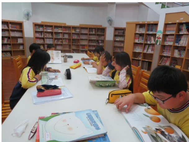
說明：學生安靜閱讀今日所發下的教材課文

在大海裡似乎用不著太多顏色，黑白便足夠了！兩色之間加上光線流動，便足以調配出濃淡萬千的色層。