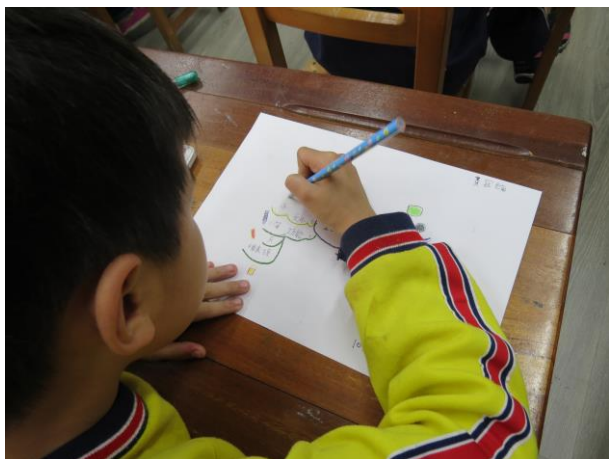
說明：分析教材一畫出心智圖