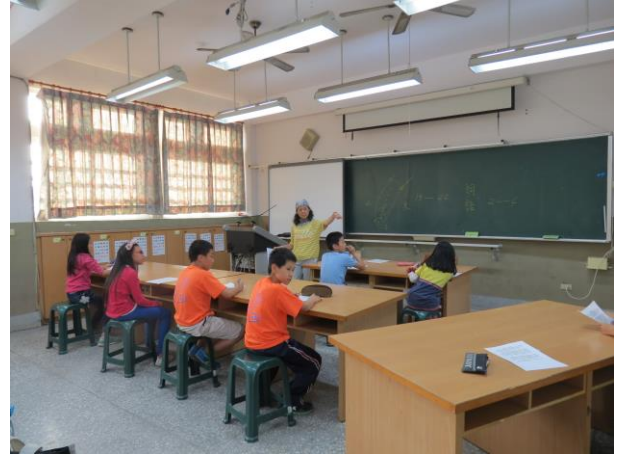
說明：老師解說今日上課主題