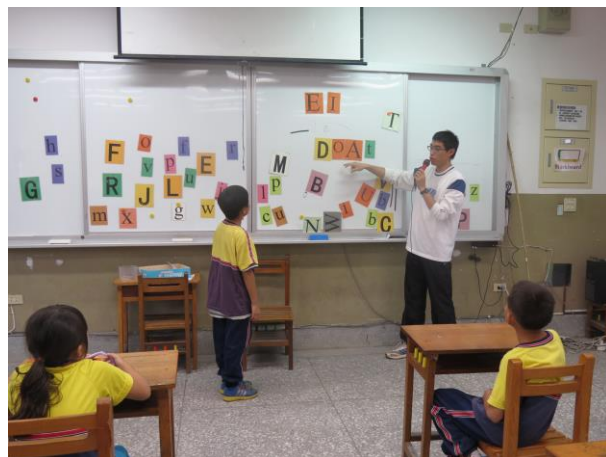
說明：老師解說今日上課主題