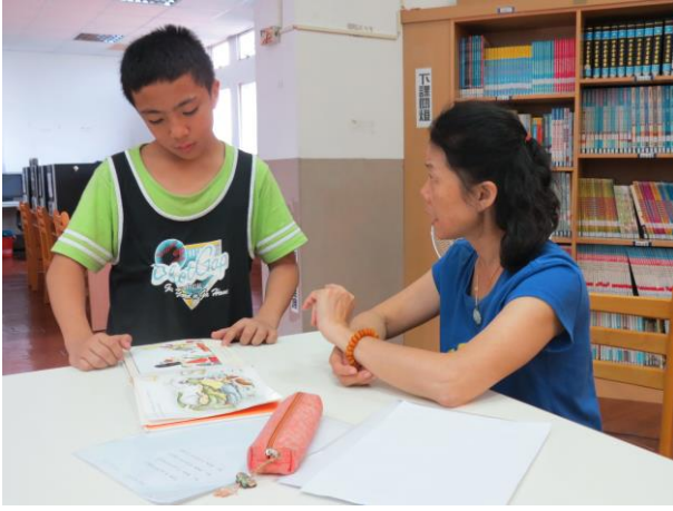
說明：學生回答老師提問