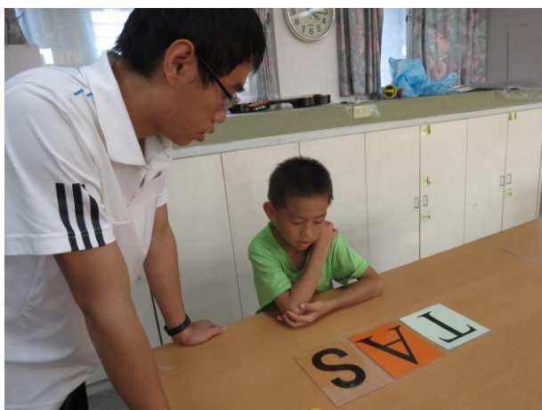
說明：學生回答老師提問