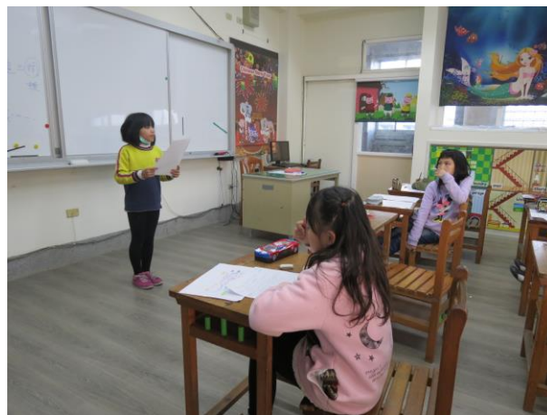
說明：上台說說各人心得