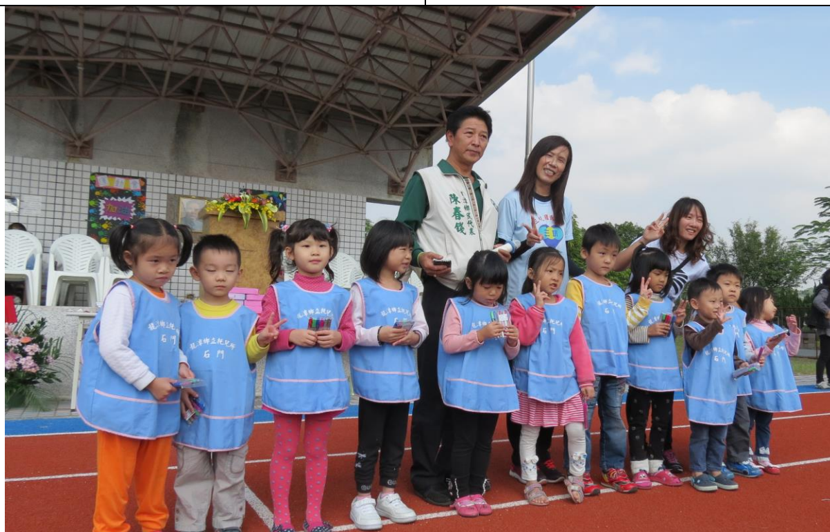
說明：大平幼稚園學生與老師表演完與三坑國小校長合影