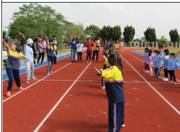
說明：穿著藍色衣服的是大平幼稚園可愛學生