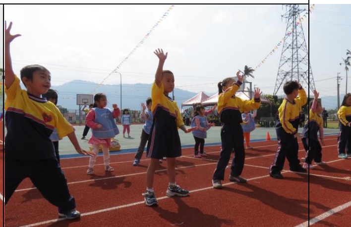
說明：大家一起跳健康瘦瘦拳