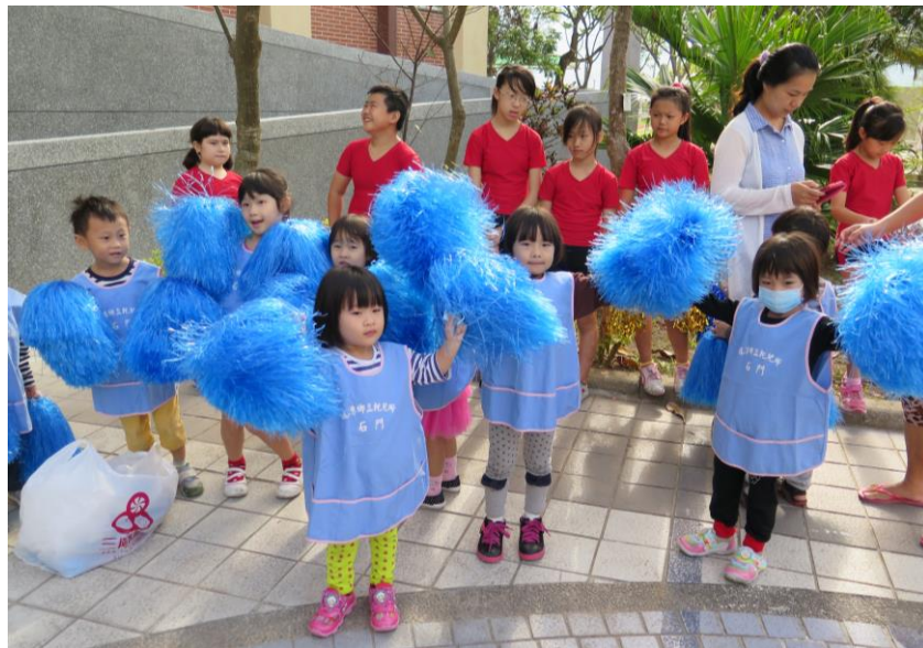
說明：好有精神的小朋友

3.5 月份新生入學前到各個新生家拜訪，說明學校特色，加強與社區聯繫溝通。(以下為學校簡介)