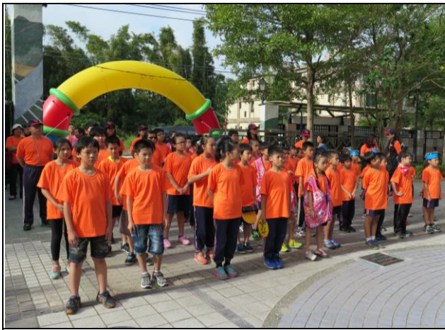
說明：三坑國小運動會暨揭牌儀式