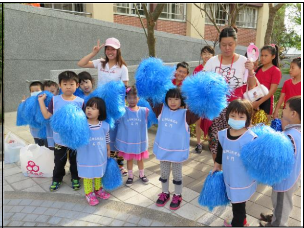
說明：大平幼稚園學生預備表演