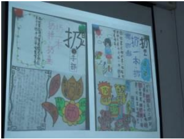
高年級的識字教學（學生作品）