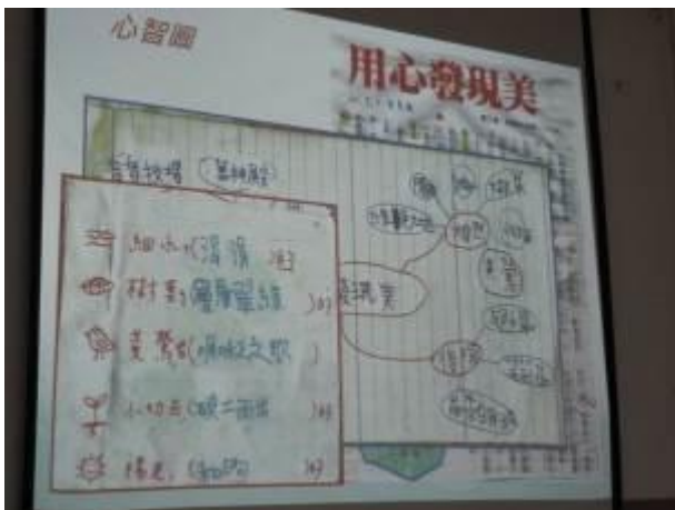
運用心智圖，學生在每個項目添加形容詞。 (學生作品)