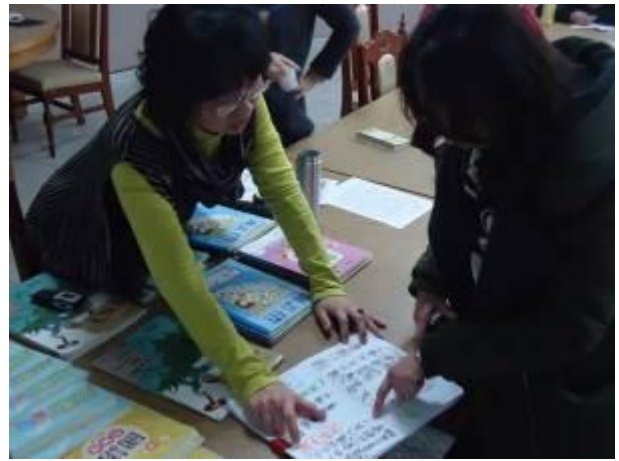
講師與本校教師參看學生作品，分享指導經驗。