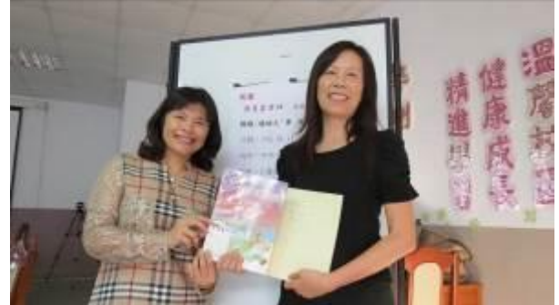
老師贈書與校長~分享議論文寫作心得