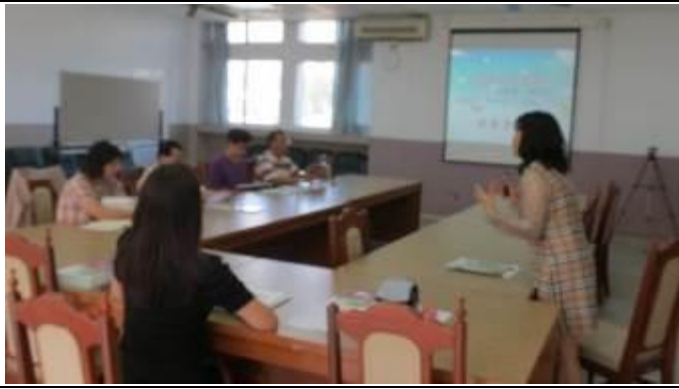
老師分析「議論文」的寫作方法~~