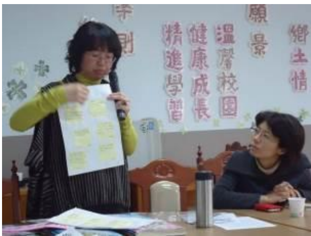
運用便利貼，小組成員可將想法記錄，便於排序。