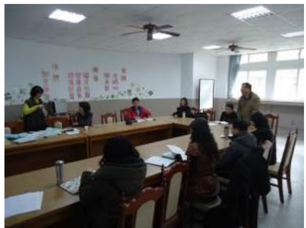
參與研討的本校教師與講師，會後進行交流。