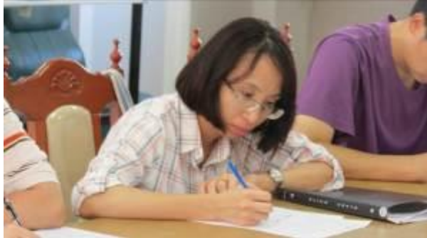
研習情景~~認真聽講