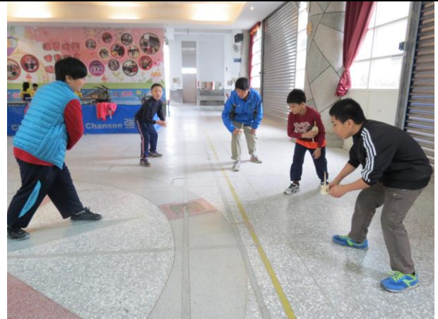
說明：陀螺PK比賽開始