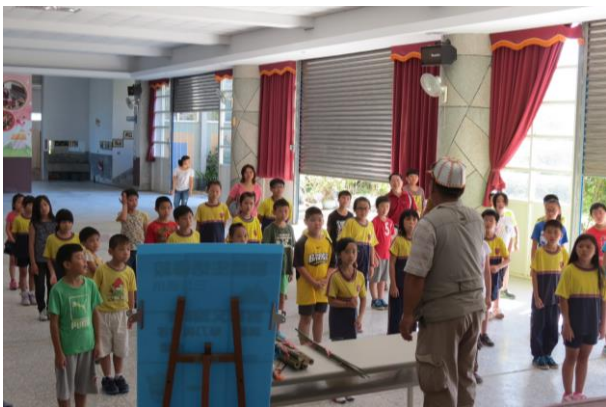
說明：講師說明今日所要製作的文物內容