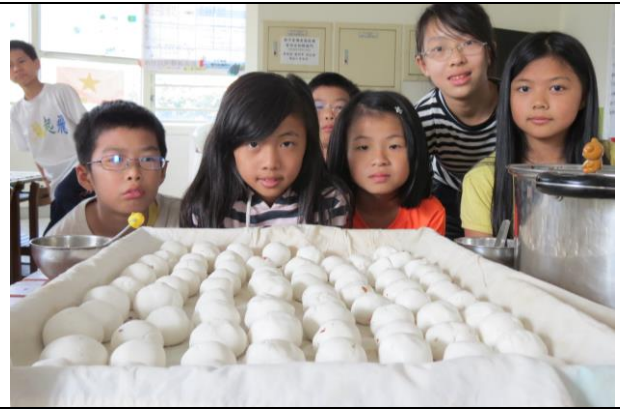
說明：包好的一顆顆飽滿的湯圓