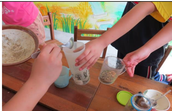
說明：各組到前面領擂茶材料