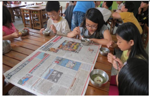
說明：大家一起分享美食