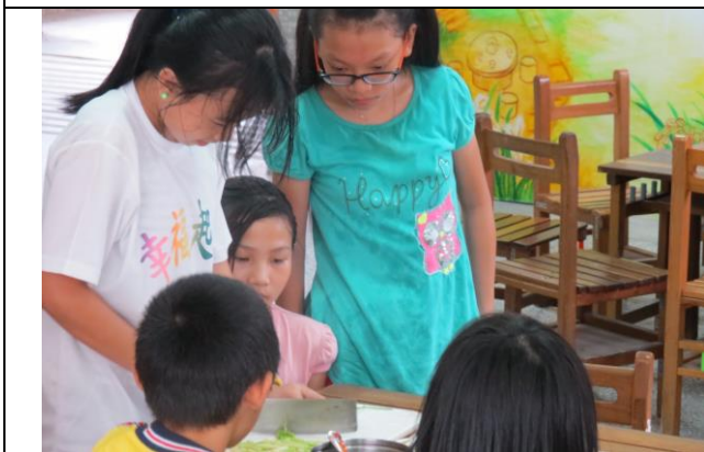
說明：各組先切芹菜，注意安全