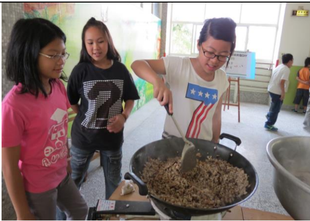
說明：先將湯圓裡的餡料炒好