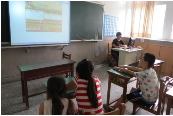
說明：學生親自操作網站進行闖關