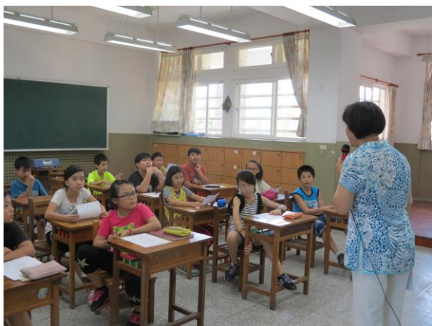
說明：薪傳師講解客語認證的重要性