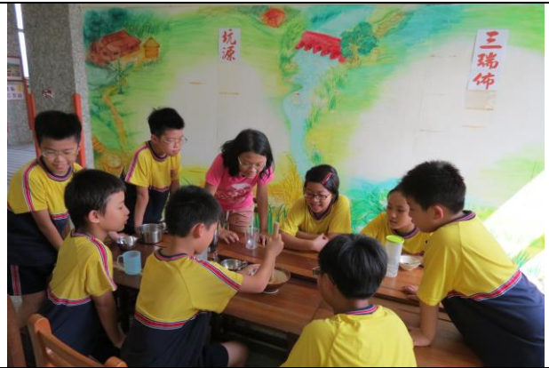
說明：各組努力擂茶