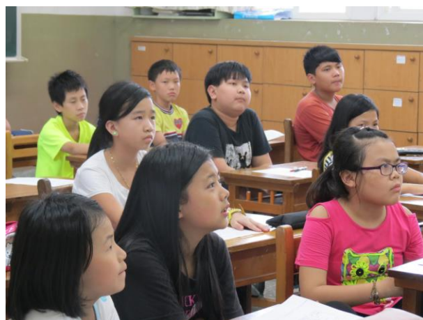
說明：小朋友聚精會神聆聽老師說明