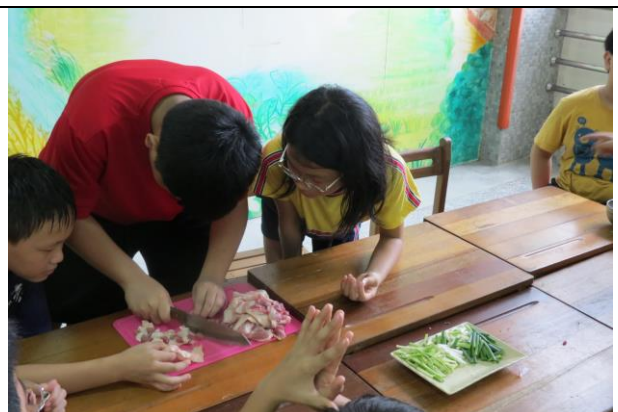
說明：各組先切豬肉