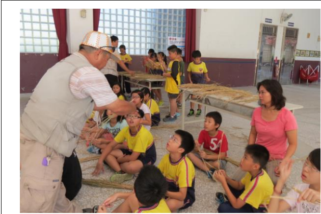
說明：講師說明稻草如何編製成草刀