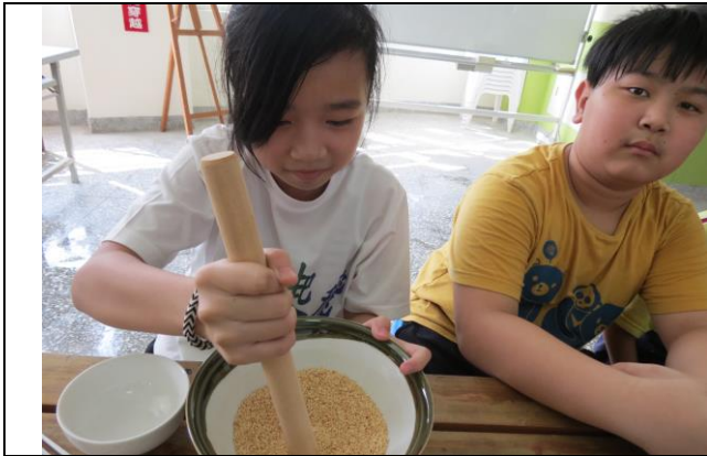
說明：老師說用木棒要直立才能擂茶