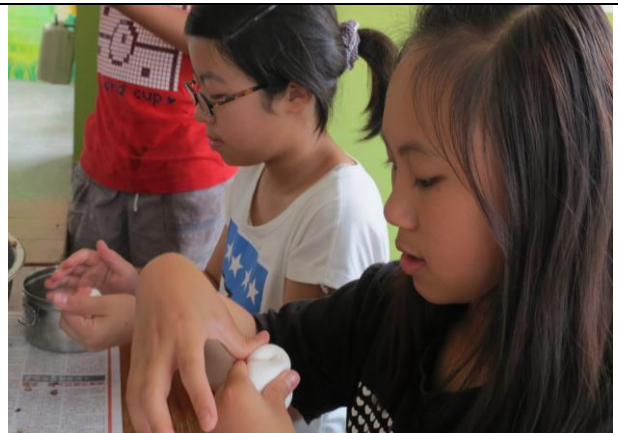
說明：將餡料包進湯圓裡