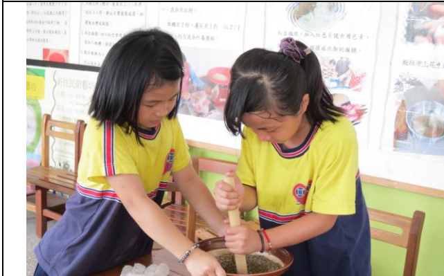
說明：我幫你握緊擂鉢，比較好擂