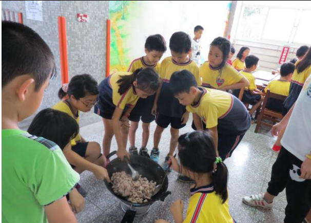
說明：大家輪流炒炒看，香氣四溢