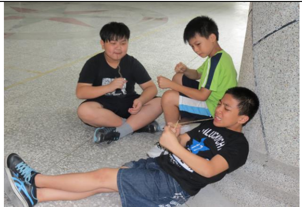
說明：學生用不同姿勢將棉線縮緊。