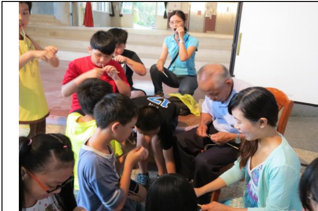
說明：大家一起學習如何將哨子縮口塑型