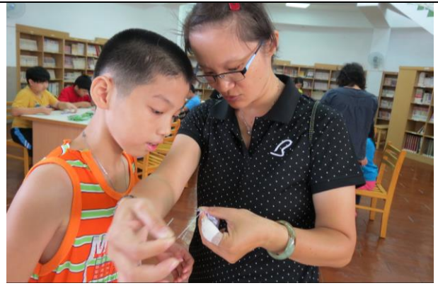
說明：講師說明如何收線