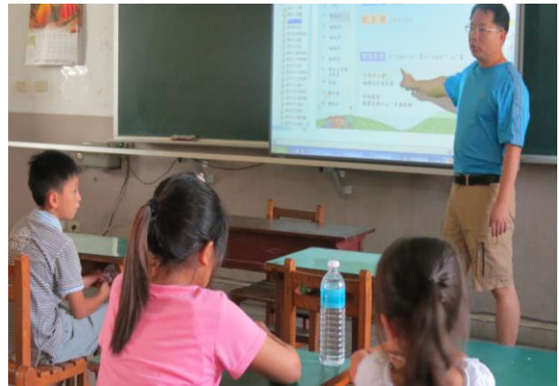
說明：老師講解客語發音問題

參、自我評量：依據自我評量指標設計表格提出評估外，並依生活化、公共化、教學化、多元化之原則自我評量。