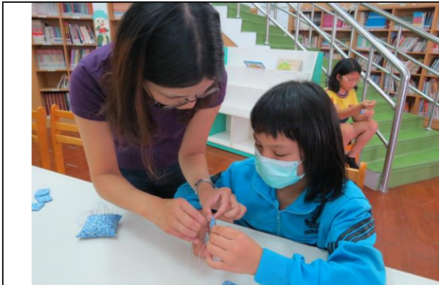
說明：老師個別指導小朋友縫製沙包