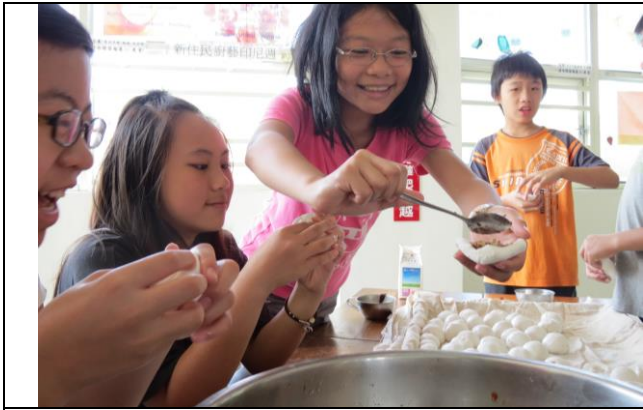
說明：將餡料包進湯圓裡