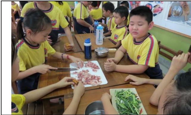
說明：各組先切豬肉