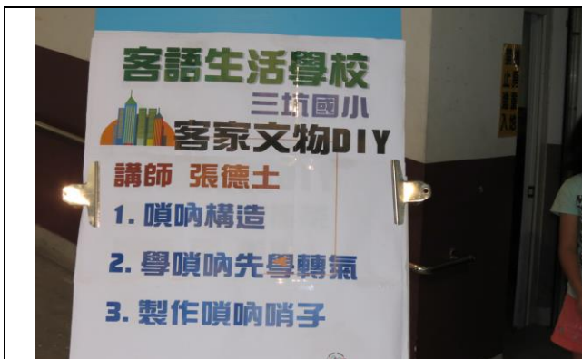
說明：今日上課課程