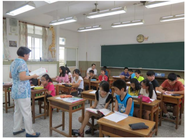
說明：老師孳孳教誨學生客語的重要