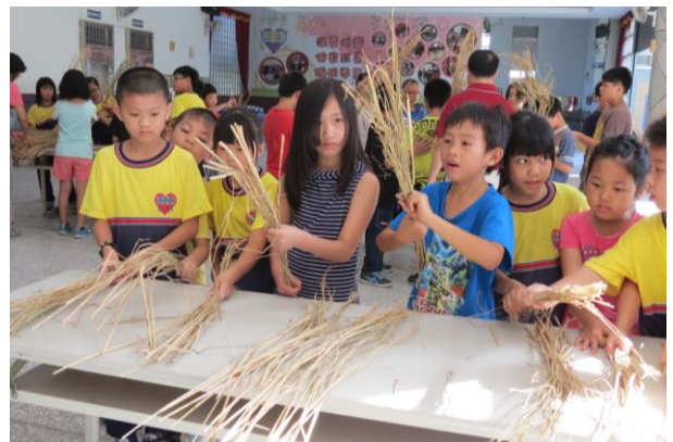
說明：分發稻草給小朋友