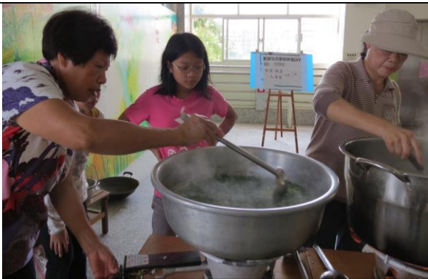
說明：開始煮湯圓囉