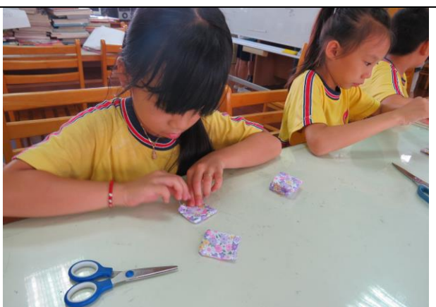
說明：學生開始縫製沙包