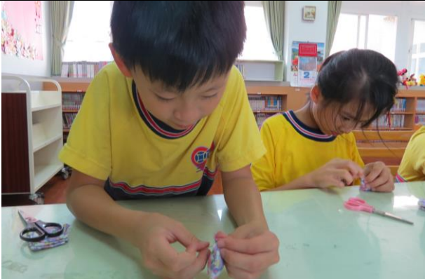
說明：學生認真縫製