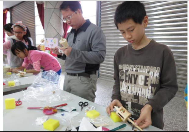
說明：將圖案剪下黏在陀螺上