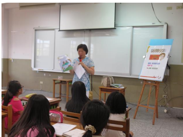
說明：老師說明易錯的辭彙