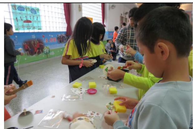
說明：開始設計圖案擺放位置