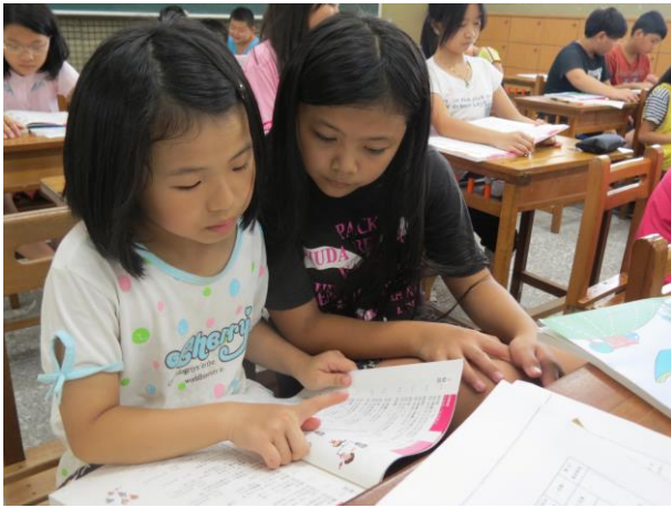
說明：同學彼此提醒注意事項