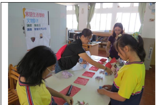
說明：講師講解今日作品材料，包含布料、針線、綠豆