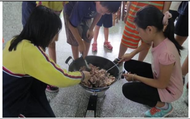
說明：將所有材料一個一個放入鍋裡炒