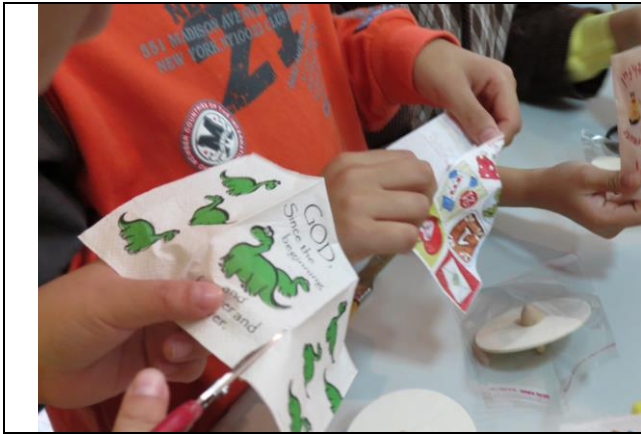
說明：將圖案剪下黏在陀螺上