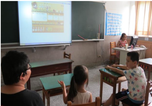
說明：同學彼此討論客語生活用語