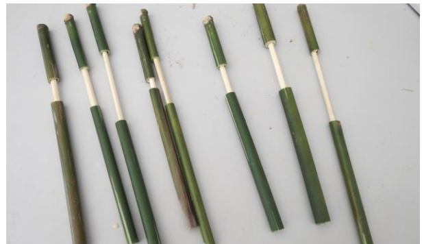
說明：筷子水槍成品