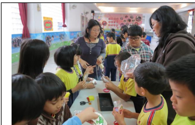
說明：講師講解完成步驟