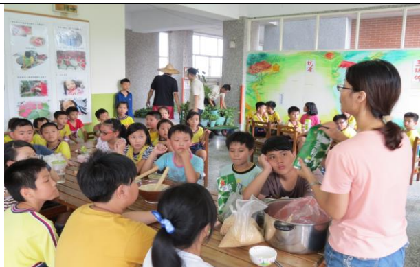
說明：講師講解完成步驟