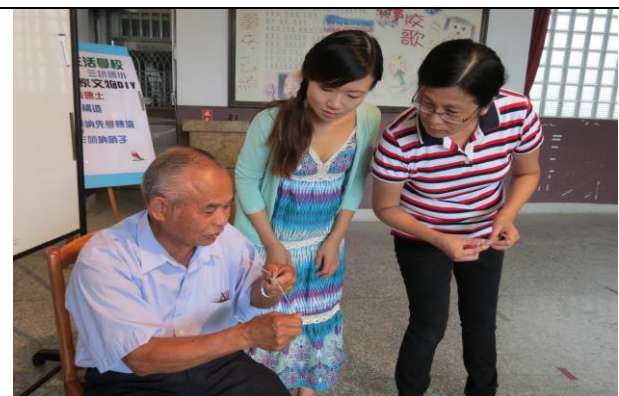
說明：講師講授用棉線將蘆竹的三分之一的部份縮口塑型