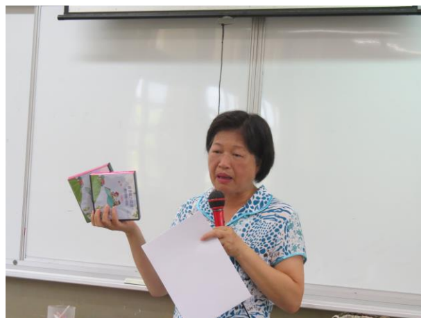
說明：通過客語認證的輔助教材