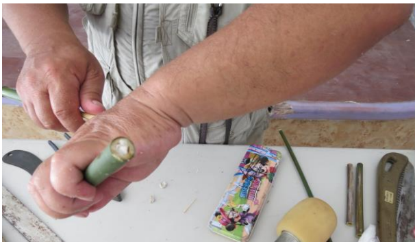
說明：講師說明如何製作筷子水槍