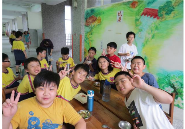
說明：一起分享美食「客家小炒」