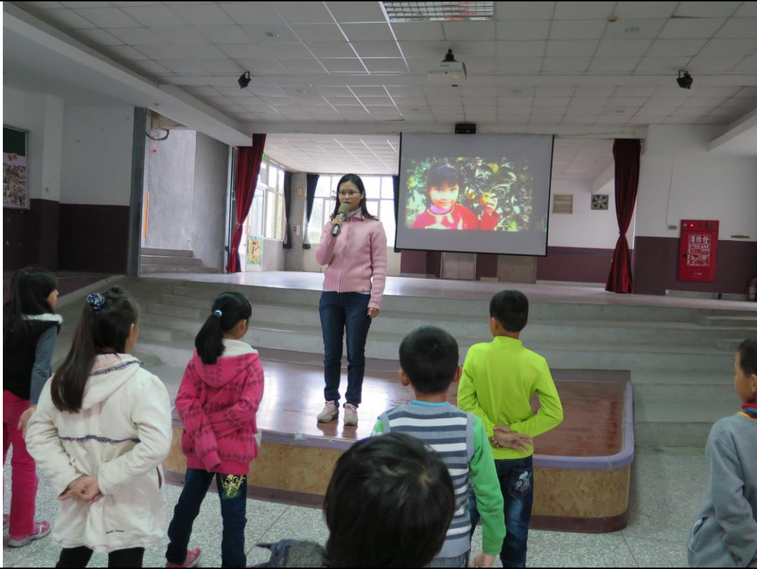
說明：播放身心障礙相關影片