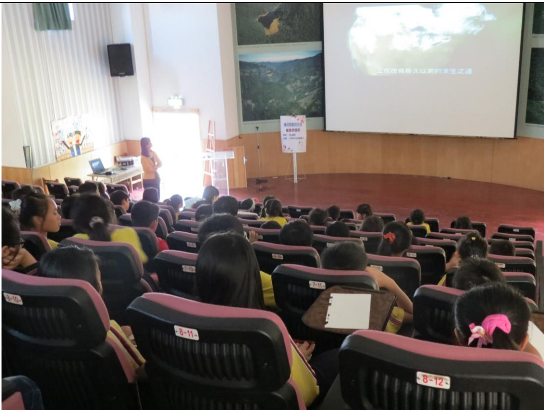
說明：播放搶救北極熊影片