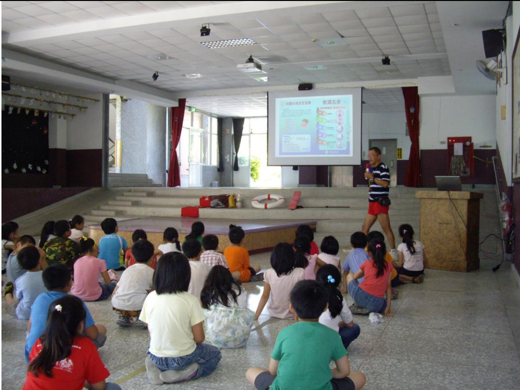
說明：水域安全宣導活動情況