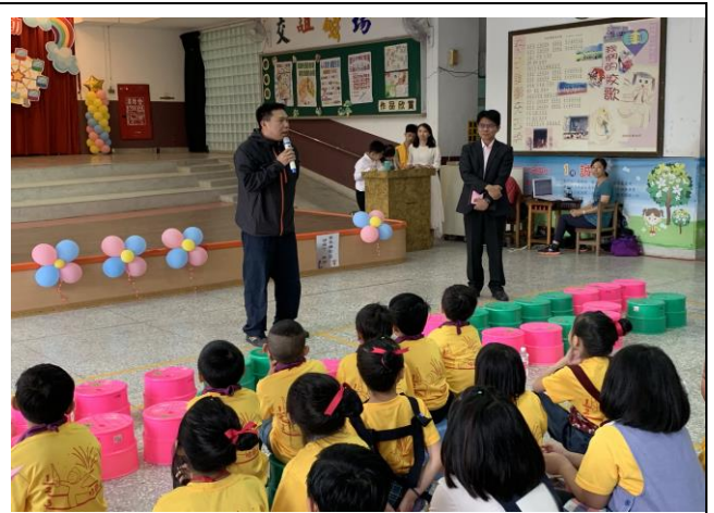
親職教育日請家長會會長宣導戴安全 帽的重要性