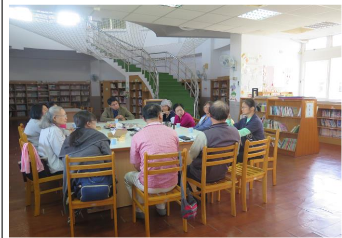
交通志工會議進行宣導