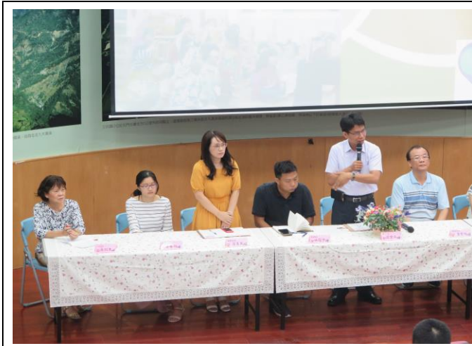
新生座談會進行宣導