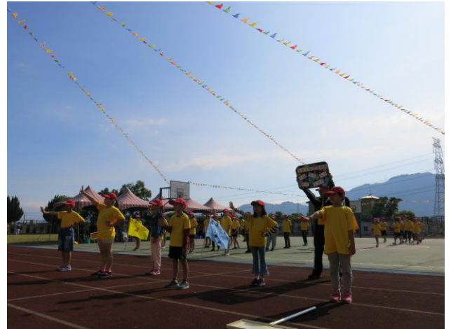
運動會進場運用學生表演方式與家長宣導