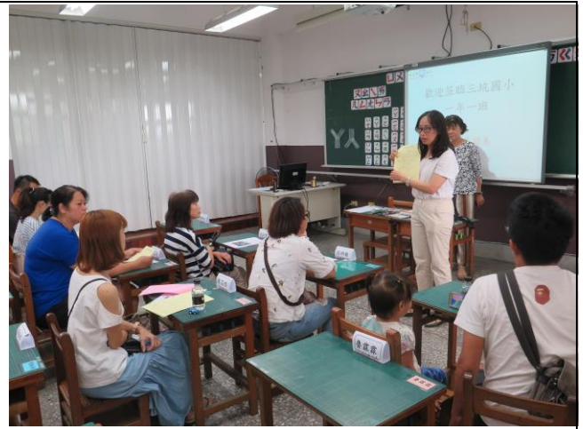
親師座談會進行宣導