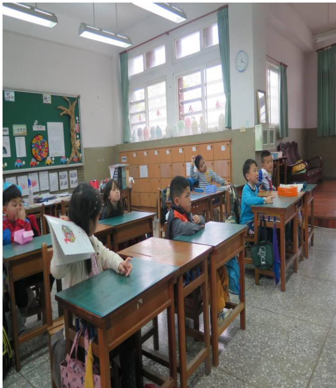
低年級交通安全暨生命教育課程