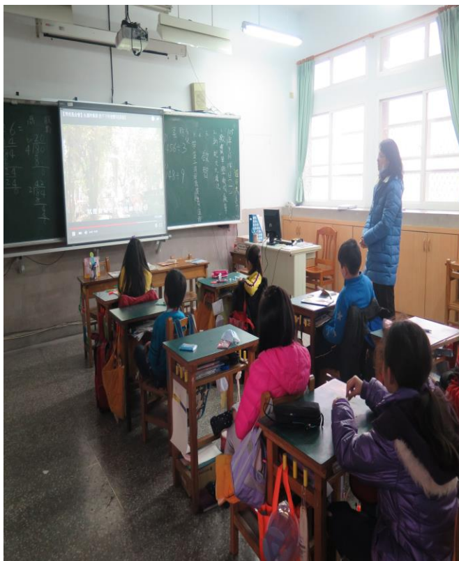
中年級交通安全暨生命教育課程