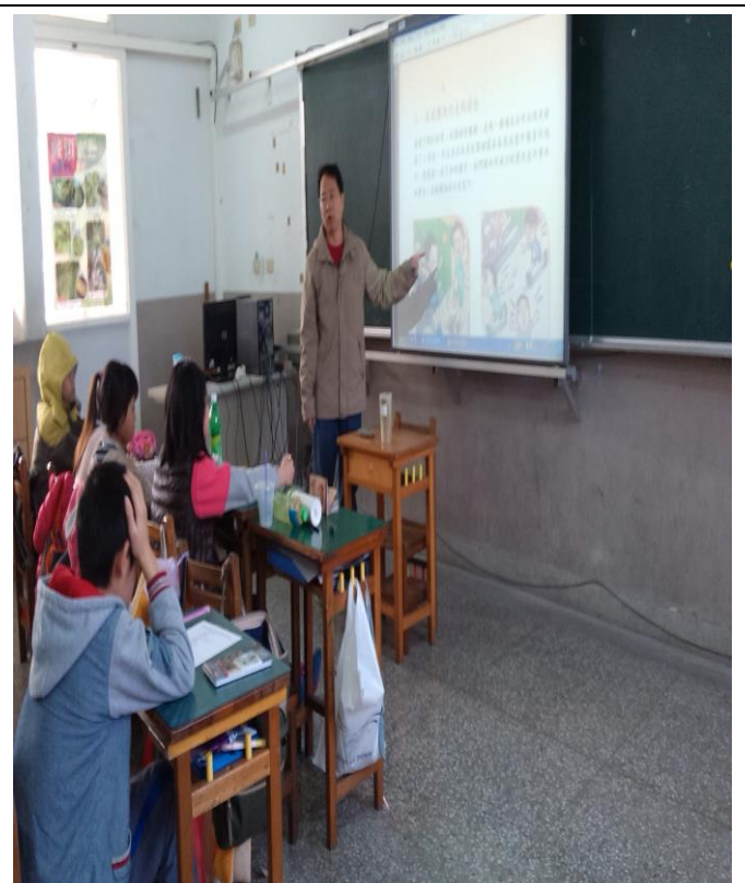
高年級交通安全暨生命教育課程