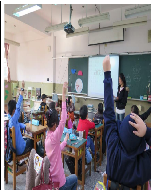
高年級融入綜合課程看影片進行有獎徵答