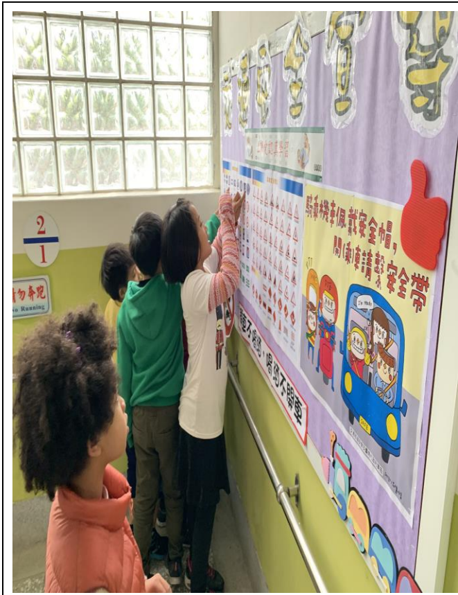
利用公佈欄教導低年級學生認識不同號誌