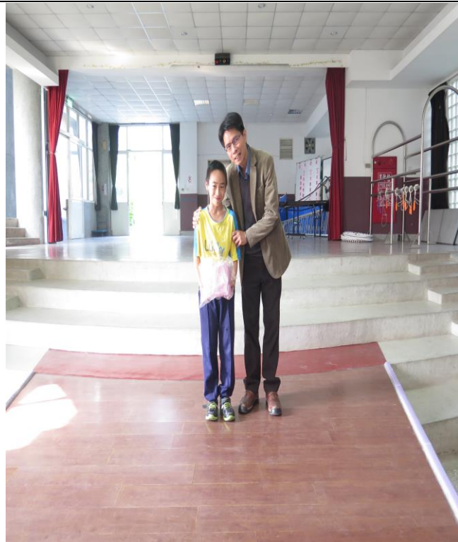
海報競賽得獎學生公開表揚