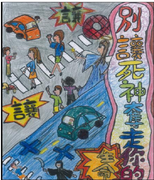
高年級交通安全宣導海報競賽得獎作品