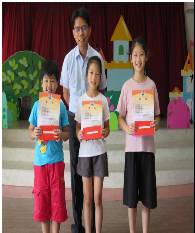
比賽前三名公開表揚