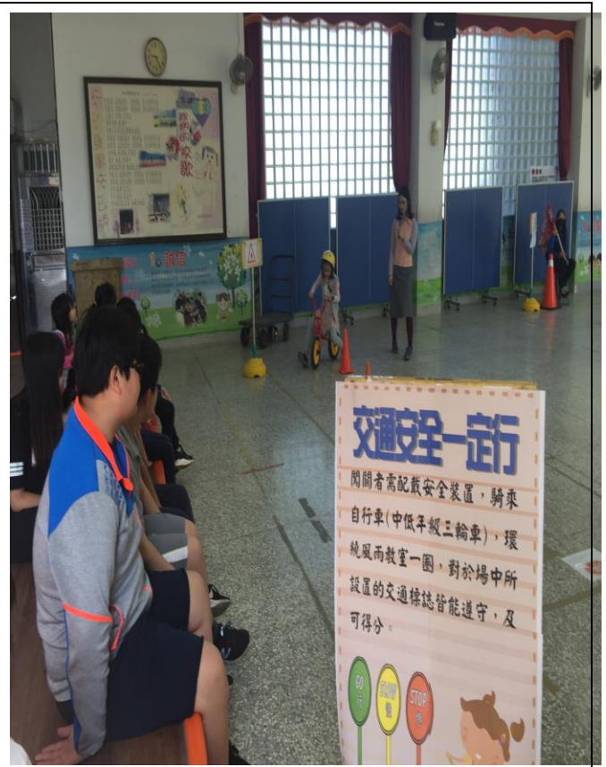
辦理交通安全體驗活動，讓學生從體驗中學習